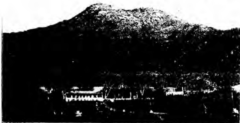
د هغه وخت د بابر بن

دغه "ممنوعه هېواد" او د کابل ښار ته ور وختلو او غوښتل مو چې يوه ننداره يې وکړو.