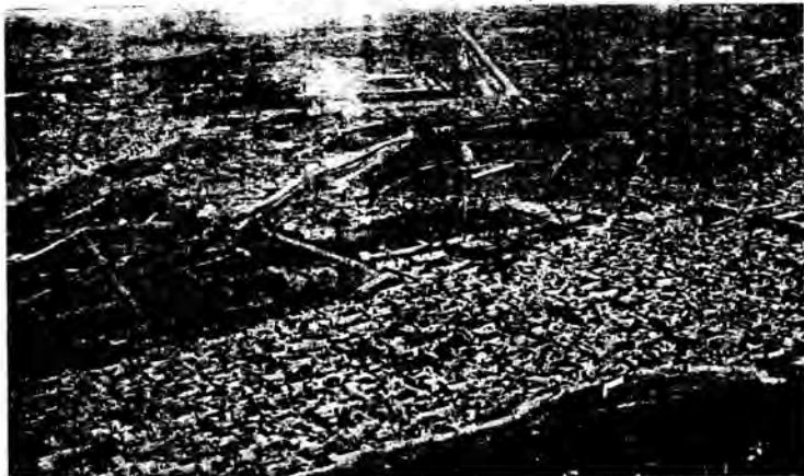
د هغه وخت د کابل ښار منظره چې خپله د نیدرماير له خوا عکاسی شوي ده

شپې له خوا به په هره دقیقه کې سپرو په خپلو منځو کې د اړیکو یو زنجیر جوړاوه. د پاشین پرله پسې څارنو او د خپلو کسانو له لاسه وتلو سره سره نوموړي وکولای شول چې د افغانستان دښتو ته ځان راوړسوي. ښه خبره دا وه چې ما په پارس کې پاتې پوځي ډلې ته له یوې بلې سهیلی لارې څخه د یون امر کې و.