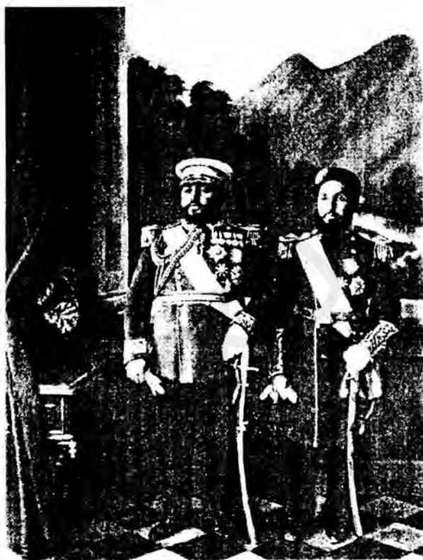
امير حبيب الله خان او نصرالله خان

په دې توگه نو موږ امير ته نوى وړانديزونه وکړل او له هغه څخه مو وغوښتل چې په لنډ وخت کې غوڅ ځواب راکړي زموږ د دې وړانديز په هکله چې "هينتهگ" به يوازې حرکت وکړي داسې ځواب راغى چې يا به ټول همدلته پاتې کېږو او يا به ټول يوځاى سره روانېږو دا ځواب له امير سره د هند د مرستيال واکمن د اړيکو په پام کې ساتلو سره د ډېرې حيرانتيا وړ نه و خو د ځواب راکولو بڼه يې ښه نه وه د ځواب دغې بڼې دغه هېواد کې زموږ د نورې استوگنې په اړه له موږ سره پوښتنې راپيدا کړلې خو په نورو خبرو اترو کې به موږ ته ډېرې ژمنې وشوې. خو هغه ژمنې به نه راڅرگندېدلې چې موږ به ټينگار پرې کاوه ماته ډېر ژر څرگنده شوه چې موږ