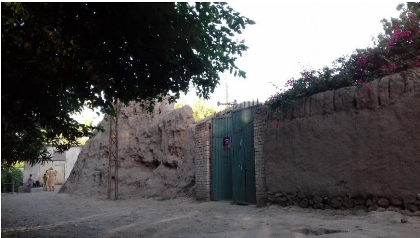
۴. انځور: د ظلم آباد کلا

ددې تاريخي کلا په تړاو د خلکو ترمنځ بېلابېل روايات موجود دي او همداسې له نسلونو يو بل ته راپاتې دي، خو کره نېټه معلومه نه ده .