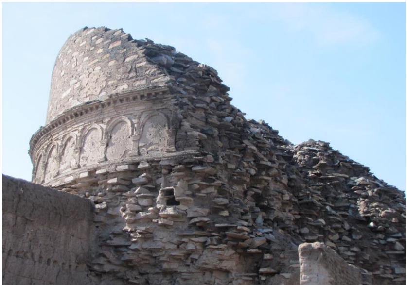
۲. انځور: د بیمارانو هستوپه

سمسوري کروندې له پاسه پرته ولیدل شي . د بیمارانو همدا تپه ده چې پکې د چترې هیرمیگا یا د هستوپې چترې پستي او بهرنی روغې سطحې موجودې دي او د هونیک بیرگر له خوا پکې کیندنې شوي دي ، ددې هستوپې دننی سلنډر له منځه یوه فلزي جوبه تر لاسه شوه چې په هغه کې میناتوري شوې کوچنۍ هستوپه چې په اصل کې د دیگوراتیف او مهندسي هنر له پلوه په سرو زرو ښکلې شوې ، د نیوترمیگاش یوناني لوی شخص ۲۷ دانې مسي سکې هم ترلاسه شوي دي ، د بیمارانو د نهم نمبر هستوپې په ساحه کې ښکلاییز دوه توسه چې د ترلوک دولس رواقونه یې درلودل د دیاپري خوشه ییز او په ریگ او چونې پلستر شوي وو ، د بهرني ساختمان سره او د پینځو زرو قطی ته ورته جعبه کشف شوه او لکه چې د نگارهارا د سیکو په بحث کې ورته اشاره شوې ده د کارنیلان په کریستال سربېره یاقوت او دیوترنیگاس شپږ دانې مسي سیکې موجودې وې .