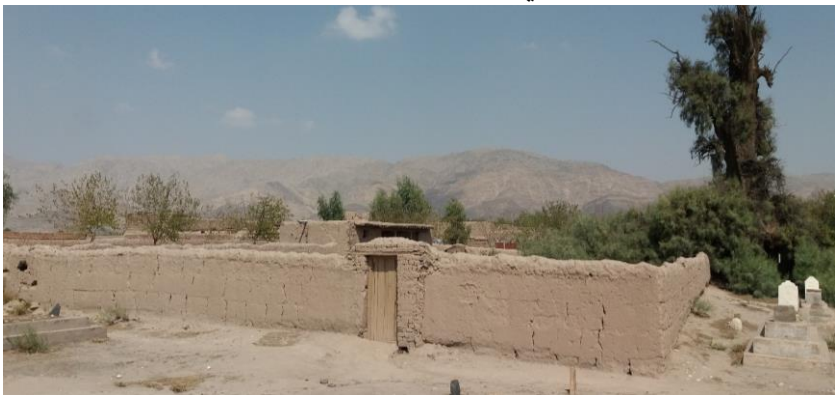
۲۱. انځور: د شهيد حاجي صيب مزار

د شهيد حاجي صيب مزار د سره رود ولسوالۍ اړوند د چهارباغ صفا نه پورته د حاجي صاحبانو کلي له عمومي سړک نه شاته او شاوخوا سل متره وړاندې دننه په کلي کې دی چې يوه چارديوالي ترې تاوه ده. سيد محمد صاحب چې په تا معمر مشهور و، د شهادت نه وروسته په شهيد حاجي صيب شهرت وموند چې مزار يې د ننگرهار ولايت په سره رود ولسوالۍ کې د حاجي صاحبانو د کلي په هديره کې دی اوس يې هم زيات شمېر وگړي زيارت ته ورځي.