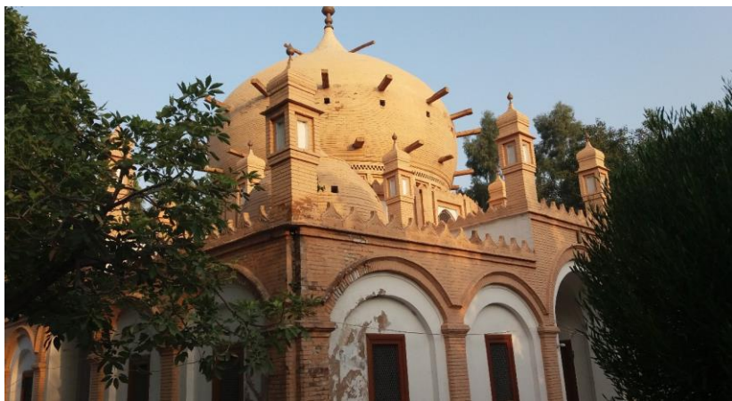
۱۷. انځور: د حضرت ضياء معصوم مجددي زیارت

په چهارباغ صفا کې د حضرت صاحبانو دغه لړۍ روانه ده او د وخت په غېږه کې یې وتلې څېرې رالوی شوي دي. په اوسني وخت کې هم د حضرت صاحب د باغ او زیارت د نومونو په اورېدو سره د خلکو ذهن ته د یو فضیلت څېره درېږي. حضرت صیب د قادریه طریقي مرشد او پیرو و. حضرت صیب ته د هدې اخندزاده صاحب لخوا د قادریه طریقي اجازه وه او د مشر ورور لخوا یې ورته د نقشبندیه طریقي اجازه ورکړل شوې وه. د حضرت صیب په اړه داسې ویل کېږي چې نوموړی د بغداد څخه افغانستان ته راغلی او د سره رود په ولسوالۍ کې مېشت شوی دی او نوموړی د حضرت عمر فاروق رضي الله عنه د اولادې څخه دی.