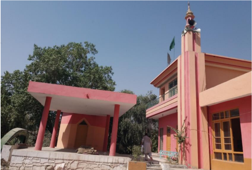
۱۰. انځور: د موی مبارک نوې ودانۍ او جومات

اولاد يې نه کېږي نو دوی يې د قران کریم په ایتونو دموي او د خدای په حکم يې اولاد پیدا کېږي. همداراز په کم وخت کې د ماشوم غورځېدلو، د لاسونو او پښو د بدنونو د کوروالي سمېدلو، د ديو نظر بند، پيران لرې کولو، صوفيان او گڼو نورو ناروغيو لپاره درمل، بندونه او دعاگانې کوي چې د الله په فضل سره ښه کېږي.