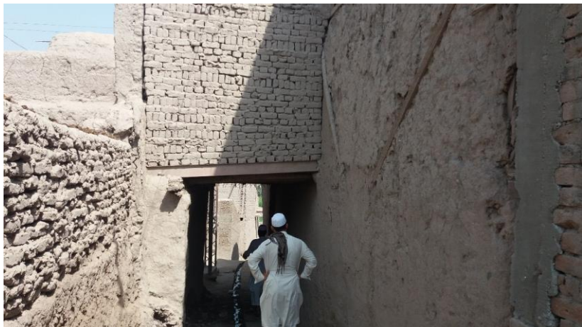
۹. انځور: د موی مبارک پخوانۍ ودانۍ

د موی مبارک سيمه د سره رود ولسوالۍ اړوند کانال ته څېرمه د سرک پر غاړه پرته ده. د سيمې دخلکو په وينا چې سلگونه کاله وړاندې د رسول الله – د ريرې مبارکې ويسته له سعودي څخه يمن ته وړل شوی و، بيا بغداد او له هغه ځايه پاکستان ته راوړل شوی او کلونه وروسته بيا کابل او له کابل څخه ننگرهار سره رود ولسوالۍ چهار باغ صفا کلي ته راوړل شوی دی چې دوخت حاکم ورته يوه اندازه ځمکه ځانگړې او ورته يې ودانۍ جوړه کړه چې اوس هم دغه ودانۍ آباده ده.