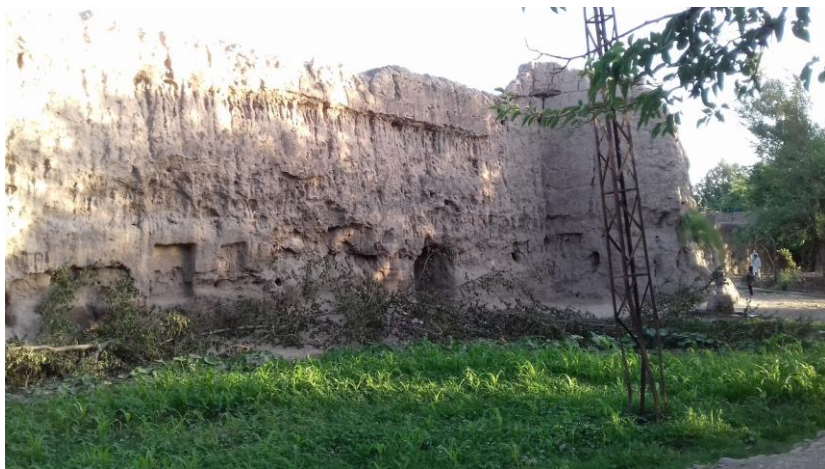
۵. انځور: د ظلم آباد کلا

دی وایي: ((نیکه مې راته کیسه کوله چې په دې کلا باندې د وخت حاکمانو د خټو کار کاوه، یوه اونۍ به یې په خټو غوایان گرځول او بیا به یې دیوال ته پورته کولې. په لاره به چې هر څوک تېرېدل، دوی به ورباندې کار کاوه. یوه ورځ د لغمان ولایت نه یو هندو پر همدې لاره سلطانپور ته راروان و چې دوی ورته د کار کولو وویل، خو هندو ورسره دا خبره ونه منله، دوی پرې ټینګار وکړ، خو هغه انکار وکړ، ددې کلا حاکم هغه هندو ونیو او په دیوال یې له پاسه کېښود او خټې یې پرې ووهلې چې بیا له همدې کیسې وروسته دا کلا د ظلم آباد په نوم مشهوره شوه او تر اوسه په دې نوم یادېږي.))