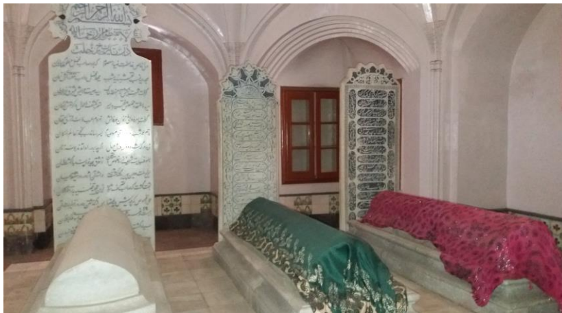
۱۸. انځور: د حضرت ضیاء معصوم مجددي مقبره

د حضرت صیب مزار ته اوس هم د هېواد له بېلابېلو ولایتونو خلک راځي، او زیارت یې کوي، په دې مانا چې اوس یې هم عقیدتمندان په هېواد کې شته.