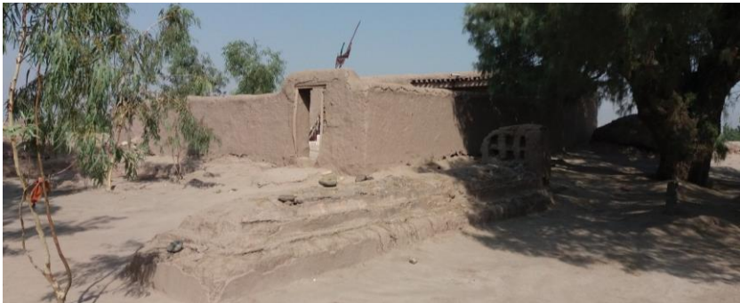
۲۰. انځور: د خلیفه بابا زیارت

د خلیفه بابا د منجاور داده گل چې اوس د ناروغۍ په بستر پروت دی، مېرمنه یې چې ددې زیارت پالنه کوي دې وایي چې دا زیارت دلته پنځه سوه کاله وړاندې جوړ شوی دی وایي: ((دلته په سره رود او شاوخوا سیمو کې چې کوم زیارتونه تاسې گورئ او لیدلي مودې، دایې مشر او خلیفه دی. خوا کې یې ساتونکي یا بالکه یې ښخ دی، زما د مېړه د پلار او نیکونو نه مور دلته یو او د دوی مزار پالنه کوو او دا ډېر رسېدلی سړی او ولي و.