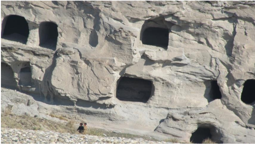
۱. انځور: د بحرآباد سمخې

نظرآباد سمخې د تاریخي یادگارونو په توګه پاتې شوي دي چې د کابل د سیند په شمالي غاړه کې موقعیت لري، له ورايه د سړي نظر جلبوي او د بودايي دور یادونه کوي. دغه سمخې د تاریخي ځایونو په توګه پاتې شوي دي، ددغو سمخو په داخل کې د بودايي دور دیني ځایونه تر سترګو کېږي چې تر اوسه پورې خونې او دهلیزونه د لیدنې وړ دي. په سره رود کې څو لوی تاریخي باغونه چې له هغې جملې چهارباغ صفا چې د افغانستان د لرغونو بېلابېلو برخو پورې اړه لري یادونه کولی شو. (۱۰: ۳۴)