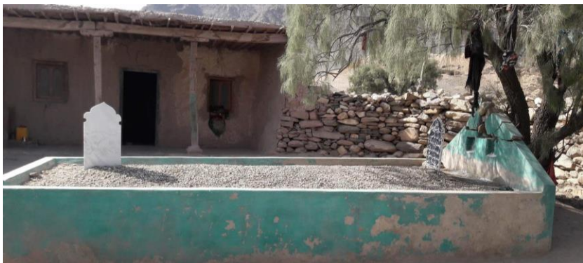
۶. انځور: د سید الیاس پهلوان زیارت