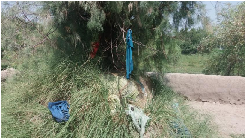
۱۶. انځور: د مبارک شاه اغا زیارت

د مبارک شاه اغا زیارت د چهار باغ صفا په کلي کې موقعیت لري، د نوموړي په اړه ویل کېږي، چې دی یو ښه او په عامیانه اصطلاح رسېدلی سړی و چې خلکو ورته عقیده هم درلوده، د ځایي خلکو په وینا دی له پورته نه د سرخاب په سیند کې راغلی او دلته په چهارباغ صفا کې یې مړی موندل شوی دی، او بیا همدلته پخواني ښار نه چې راوځي ښخ دی چې ترڅنګ یې یو مسجد هم دی.