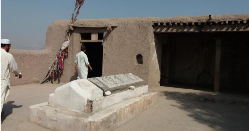
۱۹. انځور: د خلیفه بابا زیارت

دالان کې د غومبسو لویه ځاله ده؛ خو د چپچلو اجازه ورته نشته چې څوک دې وچيچي.