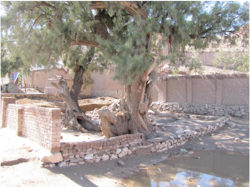
۱۱. انځور: غيبي بابا زيارت

غيبي بابا زيارت د سره رود ولسوالۍ اړوند د تور غر په څنډه کې د امرخېلو کلي په لويديځ د کانال په غاړه موقعيت لري. ددې زيارت په اړه ويل کېږي چې کله روسانو پر افغانستان په کال ۱۳۵۷ لمريز کال تېری وکړ، ټانگونه يې د تور غره په لمنه له دې ځای څخه تېرېدل، نو غيب به شول او له همدې امله يې زيارت غيبي بابا ونوماوه چې هره ورځ سلگونه تنه پر دې لاره تگ راتگ کوي.