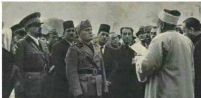
المفتي يستقبل موسوليني ويصف المجاهدين بالخوارج