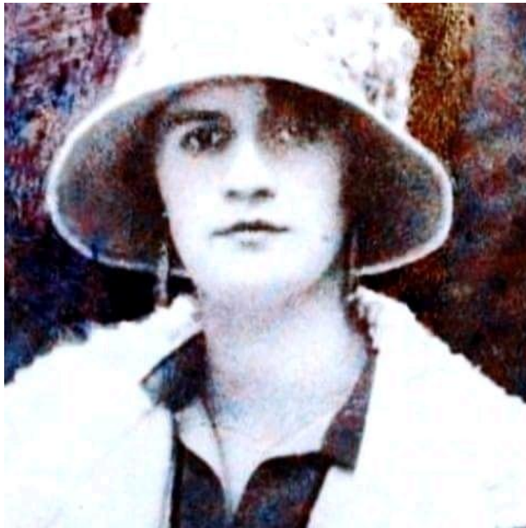
[ ملکه ثريا، د شاه غازي امان الله خان مېرمن ]

د لومړي ځل لپاره د اعليحضرت امان الله خان په وخت کې بنځو ته په نورو برخو کې هم توجه وشوه، د شاه د مېرمنې ملکه ثريا په امر په کابل کې د مستورات په نوم د انجونو لپاره بنوونځی جوړ شو، کرار کرار د بنځو تعليم او پرمختگ ته پام ډېرېده؛ خو د هاغه وخت د بې شعوره ملايانو له امله شاه اړ شو چې خپل هېواد پرېږدي، د شاه په تبعيد سره دا لړۍ هم ودرېده.