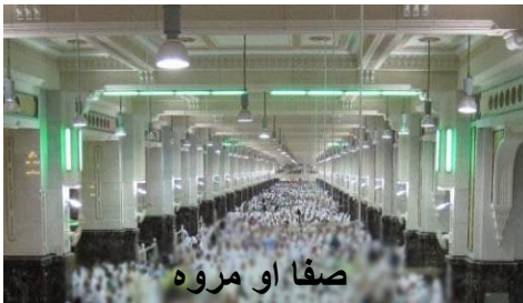
صفا او مروا

د صفا او مروا تر منځ تگ او راتگ ته سعي ويل کيږي ، په حج او عمره کي يو ځل سعي کول واجب ده ، لکه څه ډول چي او ه ځلي پر کعبې شريفې راگرځېدل يو طواف بلل کيږي دا ډول او ه ځلي د صفا او مروا تر منځ تگ کول يوه سعي شمېرل کيږي ، د صفا څخه تر مروا تگ يو شوط شمېرل کيږي د مروا څخه بېرته و صفا ته تگ دوهم شوط شمېرل کيږي دوهم ځل چي بيا همدا ډول د صفا او مروا تر منځ تگ او راتگ وکړي څلور شوطه ځني جوړيږي دريم ځل چي بيا همدا تگ او راتگ وکړي شپږ شوطه ځني جوړيږي او بيا چي د صفا څخه تر مروا پوري ولاړ سي او ه شوطه پوره کيږي .