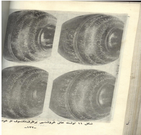
د خوات د کتیبي انځور

موزیم ته لیږدول شوې ده. دغه کتیبه تر لوبښې تاو راتاو درې کرښې لري او یوه کرښه هم ترې لاندې ده. حرفونه یې سره بیل او روښانه دي، چې د کنیشکا د زوی (-۱۸۲ ۱۶۹ میلادي) مهاراجه هویشکه په نامه لیکل شوې ده، (۵۵).