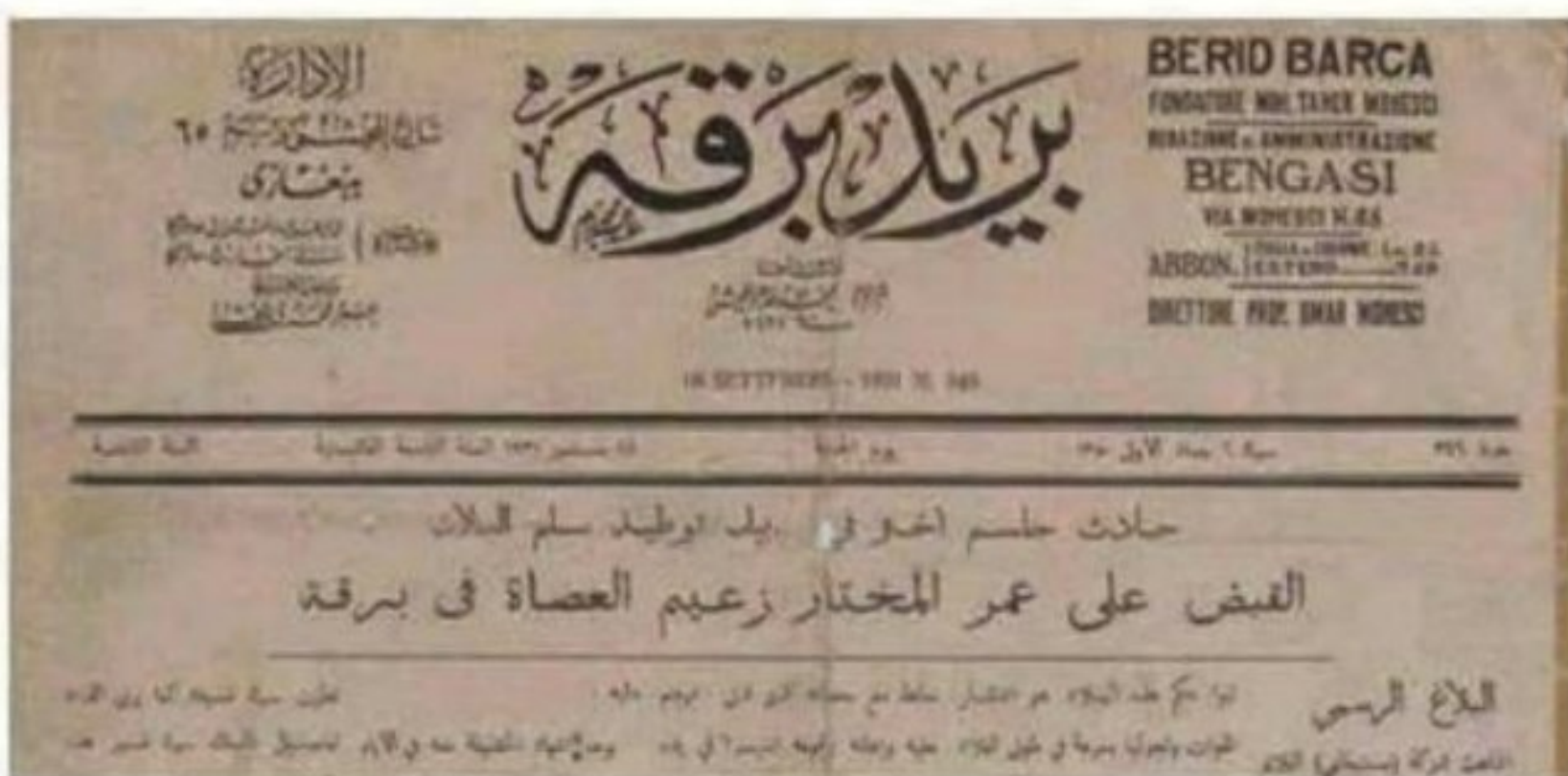
الجريدة تصف عمر المختار بأنه زعيم العصاة

دادگاه به این درخواست اعتراض و او را به دفاع از «عمر مختار» متهم می کند. اما وی می گوید که همه می دانند، «عمر مختار» محکوم به دفاع از وطن است و این حقیقتی است که همه از آن آگاه هستند. او فرزند این خاک است و طبیعی است که هرکس این خاک را به اشغال خود درآورد، دشمن خود بداند و تا جایی که در توان دارد، مقابل کسانی که خاک کشورش را اشغال کرده اند، مقاومت کند. اما دفاع این افسر ایتالیایی فایده ای نداشت و حکم اعدام به «عمر مختار» ابلاغ شد و او تنها به این جمله اکتفا کرد که «حکم تنها از آن الله است .. إنا لله و إنا إليه راجعون».