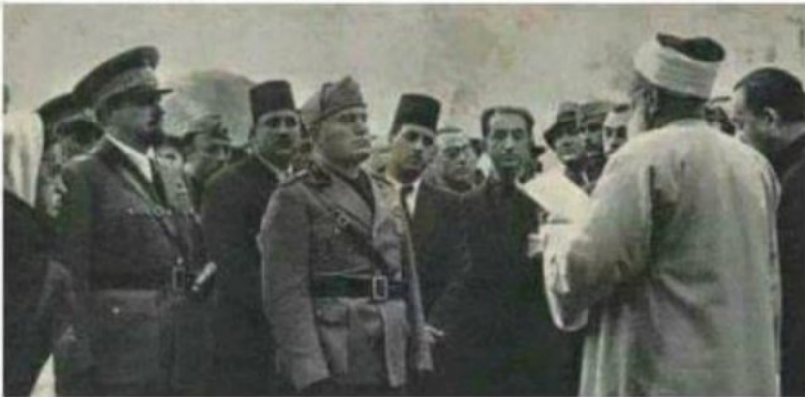
المفتي يستقبل موسوليني ويصف المجاهدين بالخوارج