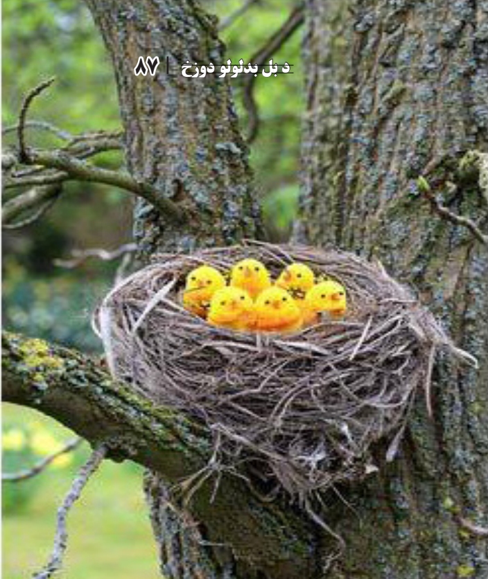
زه پر ژوند مین یم. زه هغه یم، چې اوسم.»