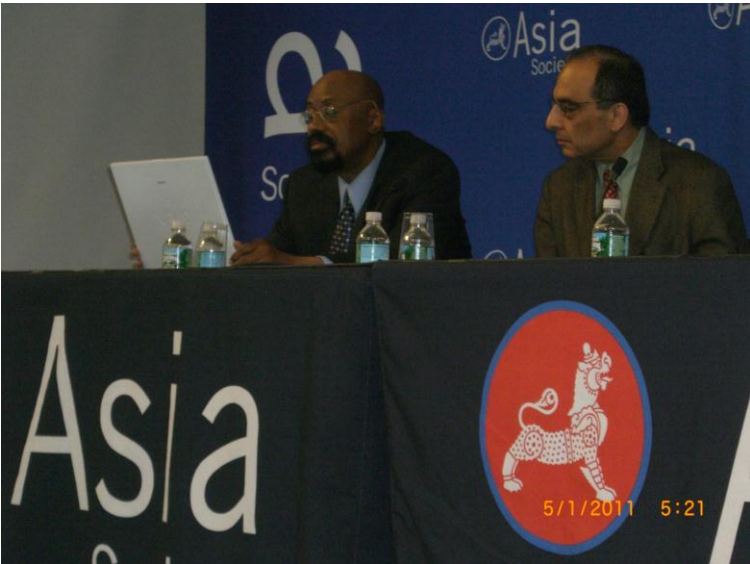
ددي دستوري يو بل عكس