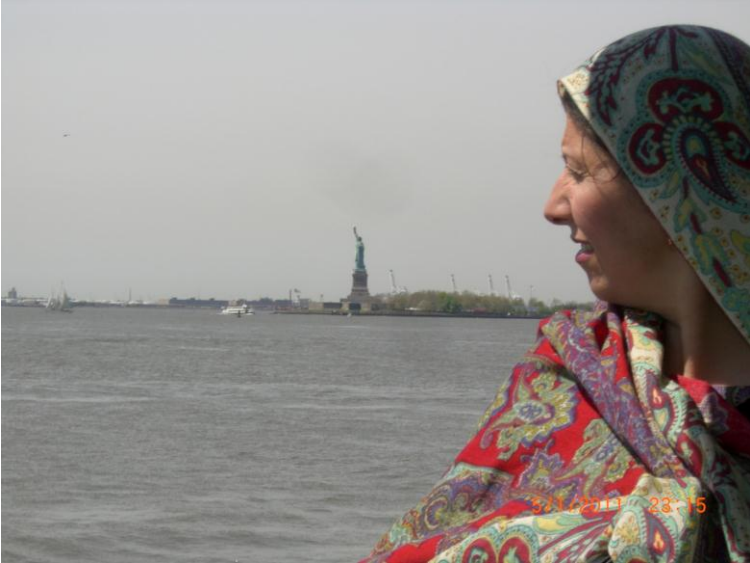
يو بل عکس د سمندر د غاړې