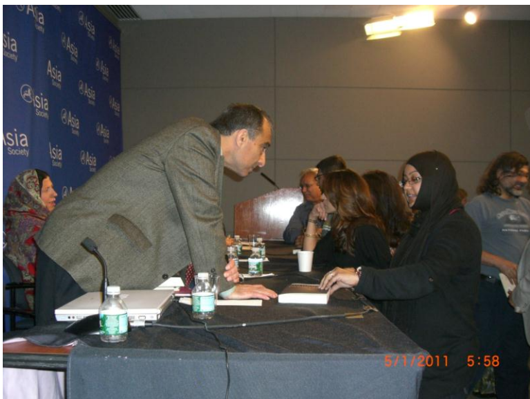
د کتاب د پلورلو پر مهال