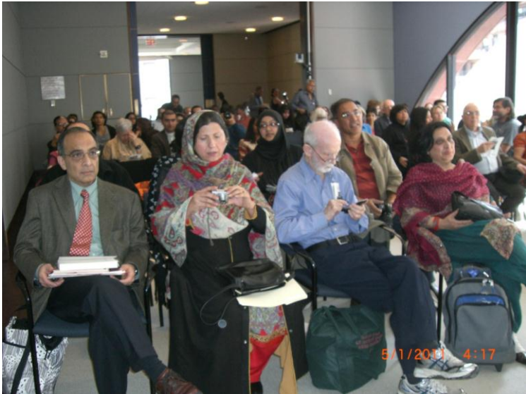
په نیو یارک کې د دستوری پر مهال