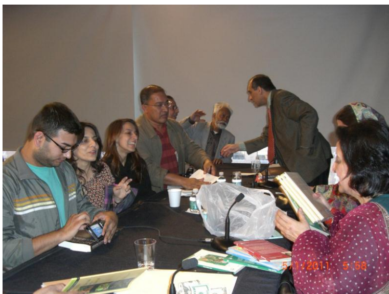
د فهمیده ریاض د کتابونو خرڅېدل