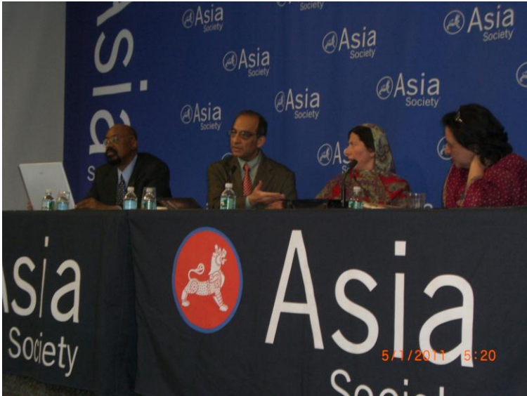
د ایشیاء سوسائیتی یو رابطه کار، وقاص خواجه حسینه گل او فهمیده ریاض