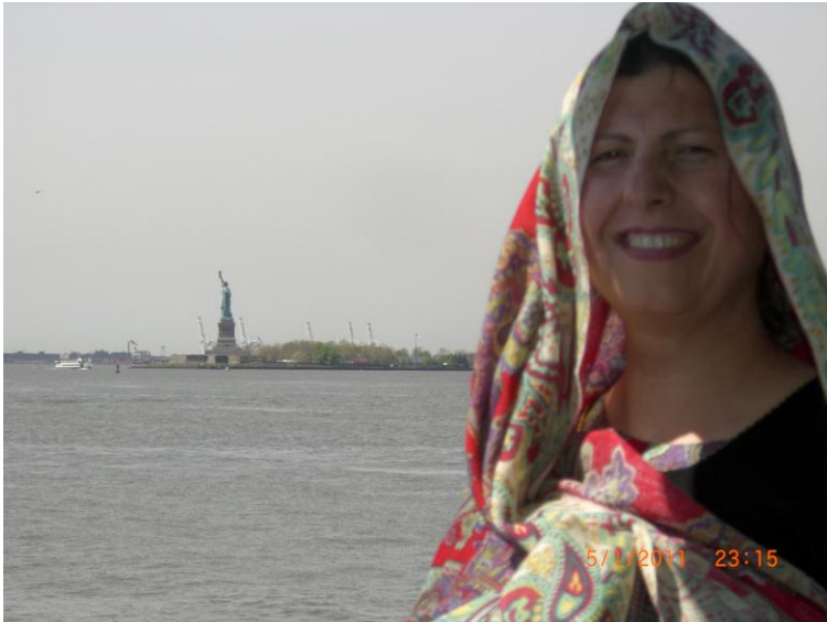
د سمندري هواگانو په ټيل نا ټيل کې