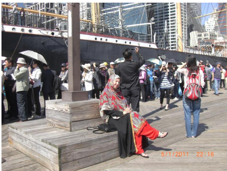
د نيو يارک د سمندر د غاړې يو بل عكس