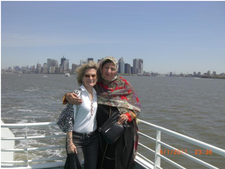
زه او پيني اوجيده