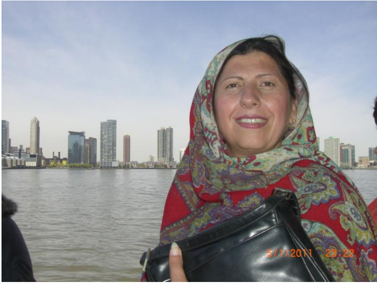
د بلي غاري سيل