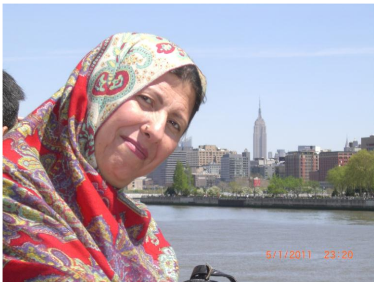
نیو یارک بنار د کشتی سیل او سمندر غاره