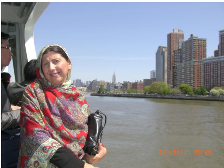
د سمندر چکر د بلی غاری سفر