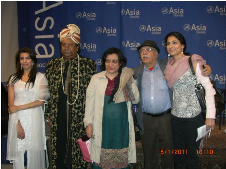
په نيو يارڪ کي د اردو ژبي له ليکوالو سره