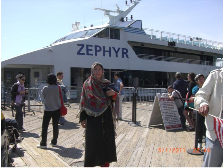
کشتی کی د کیناستو نه وړاندې