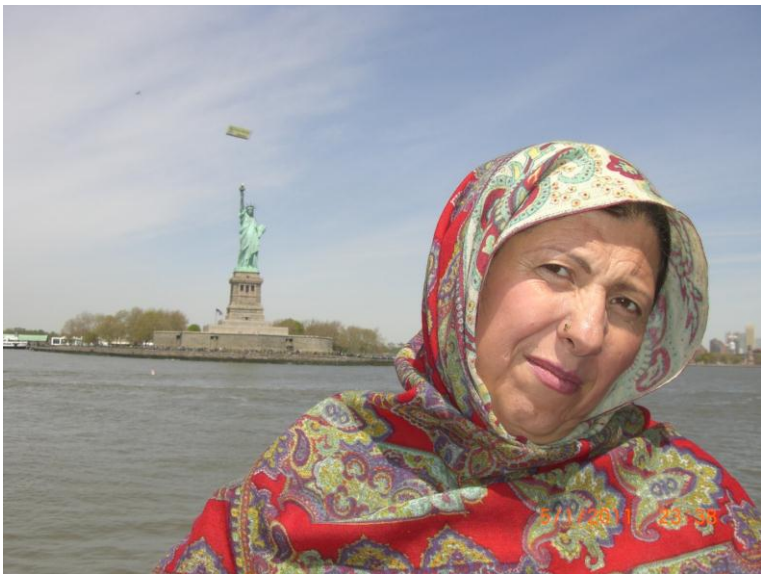
د سمندر غاړه نیو یارک