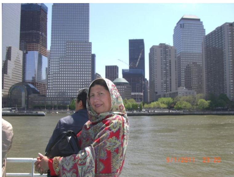
د بنار يو بل منظر د سمندر نه