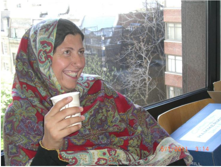
د ایشیاء سوسایٹی دفتر