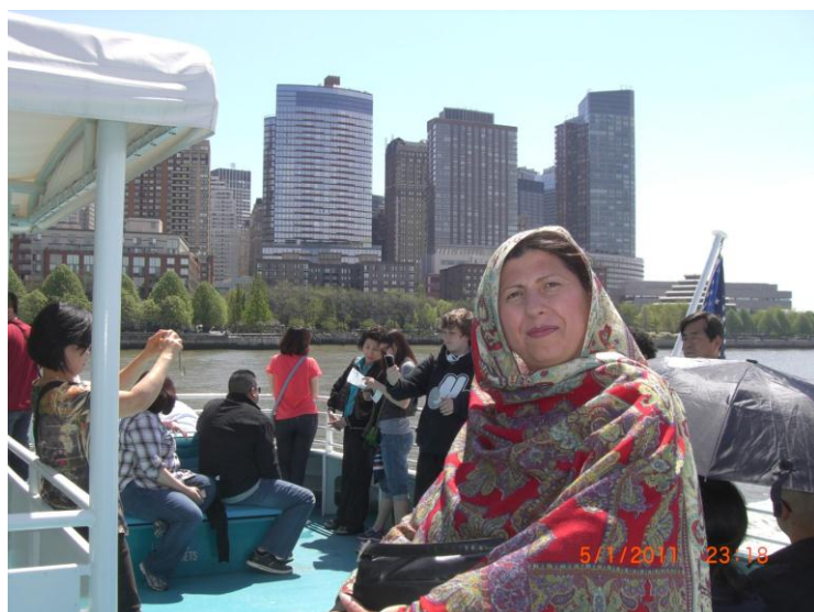
راغلي سيلگر، او زه