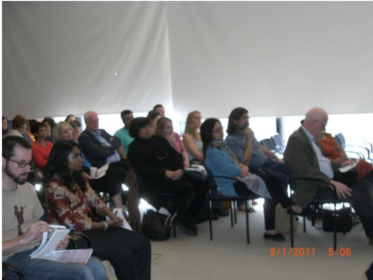
د غونډی نور گډونوال