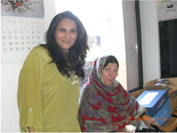
د ایشیاء سوسائیتی نیو یارک په دفتر کې