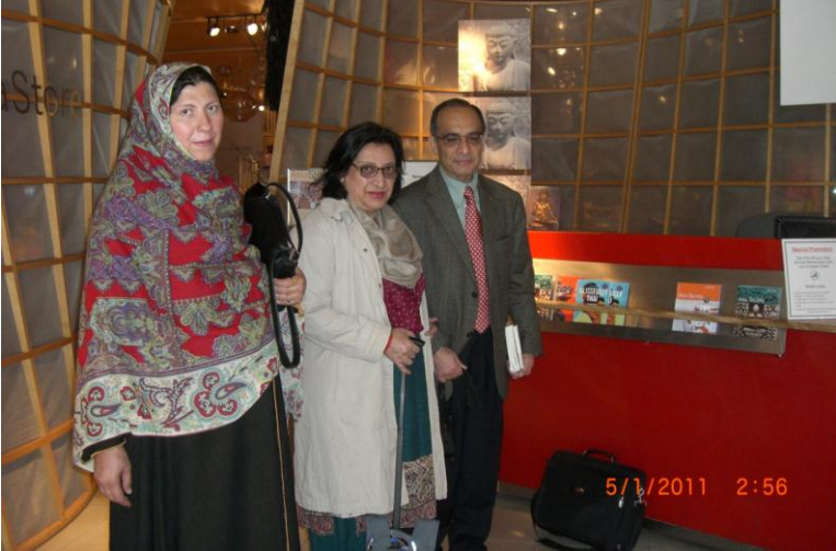
په نیو یارک کي د دستوري نه مخکي