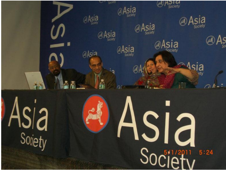
فهميده رياض د وينا کولو پر مهال