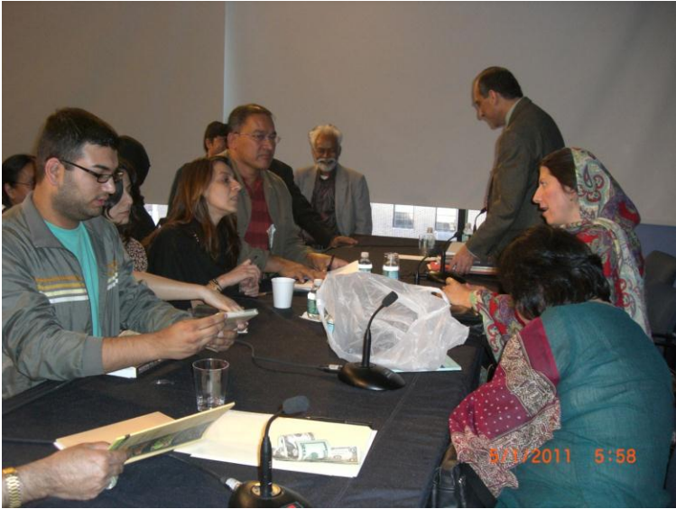
زما د ناول ملڪه بي ارزي