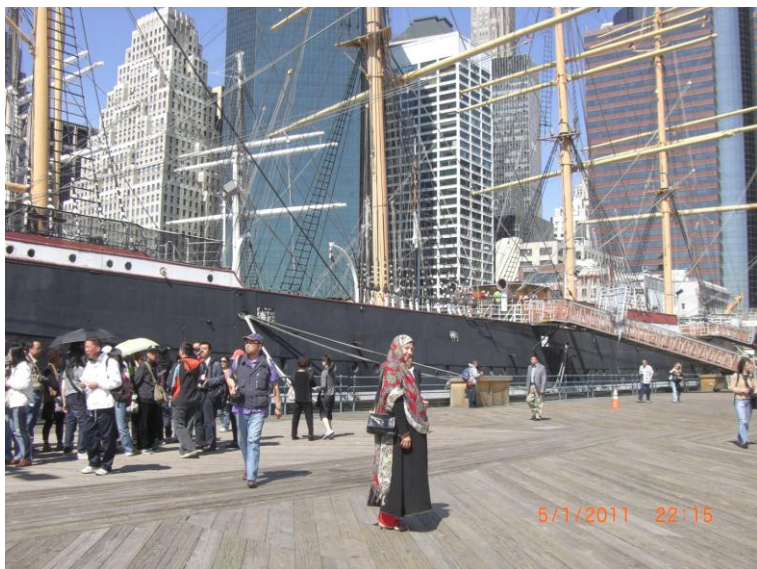
د سمندر د غاړې يو بل عكس