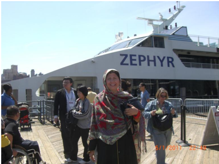
یو بل عکس