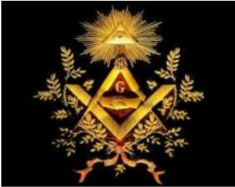
د فریمیسنانو نښان چې یوه سترګه (د دجال سترګه) شیطاني نور او هرم په کې دي

والتر لسلي هغه څوک چې د غربي لوژ یارک شایر یو مهم غړی دی په خپل کتاب (د مېسنرۍ مانا) کې دا ډله خلکو ته ورپېژندلي ده. د هغه په وینا مېسنري په خپل