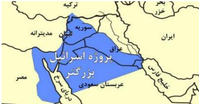
په نقشه کې هغه سیمې په گوته شوي چې اسراییل یې د نیولو پلان لري

د صهیونېست ټولو مشرانو د اسراییلو پر پروژې باور لاره، په دې اړه تئودور هرزل د صهیونېستانو پلار د خپلو خاطرو په کتاب کې داسې لیکي: د یهودي دولت قلمرو د مصر له سیند څخه تر فرات پورې ادامه لري ۲ او یهودي خاځام د فیشمن په نوم چې د ملگرو ملتونو فلسطین ته د رسیدگۍ په ځانگړې کمېټه کې د فلسطین لپاره د آژانس غړی و د ۱۹۴۷ زېږدیز کال د جولای په ۹ مه یې داسې وویل: د موعود هېواد د مصر له سیند څخه تر فرات پورې ادامه ولري او د سوریې او لبنان ځینې هم په کې دي ۳ .