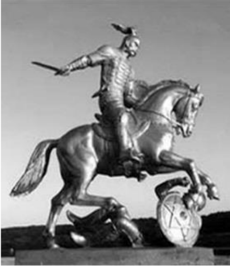
د خزري عسکر د شپږ مخیز ستوري نښان چې د اوسني اسرائیل د بیرغ نښه هم ده.

د یهودیت په تاریخ کې د لومړي ځل له پاره غیر سامي ۱ خلک په ډېر مرموز او ماهرانه توګه هغه دین ته چې پیروان یې تر یو ځانګړي نژاد پورې تړلي بولي (یهودیت)، ته واوښتل.