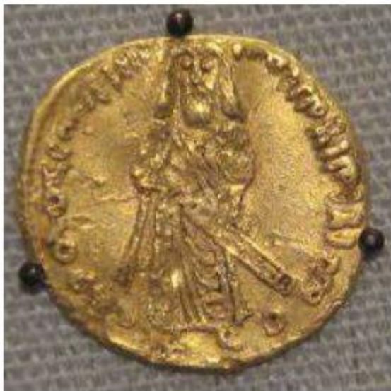
د امويانو په واسطه جوړه شوې سکه

په اړه قضاوتونو د اسلام د ننني امت وضعیت ته کومه گټه نه ده کړې، بلکې د اسلامي امت د پارچه پارچه کېدو لامل شوي او د دښمن ژرندې ته اوبه اچول دي؛ نو له دې امله باید اسلامي امت ځان د دواړو لوريو د حقانیت پر اثبات بوخت نه کړي. د حضرت علي عليه السلام په شهادت سره د قدرت واگي معاويه په لاس کې واخيسته چې