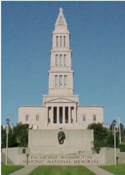
د مېسنانو په واسطه د جورج واشنگټن د یادگار مېسني ودانۍ.

د اتلسمې پېړۍ په تاریخي مزل کې د ډېرو تاریخي کتابونو پر خلاف، دلته نه له کوم حکومت، سیاسي حرکت او نه هم کومې اېډیالوژۍ یادونه کېږي، بلکې له یو اروپایي یهود څخه چې میر راتشچایلد (Mayer Amschel Rothschild) نومېږي او وروسته یې کورنۍ د نړۍ سیاسي اقتصادي تاریخ ته بدلون ورکړ یادونه کېږي. میر راتشچایلد یو عادي صراف و خو ځان غوښتونکی خوی یې لاره، د جرمني د فرانکفورت په کوڅو کې پر سوداګرۍ بوخت و. له صرافۍ پرته یې د هغه وخت د نورو یهودیانو په څېر سود هم کاوه. د هغه وخت یهودیان په اروپا کې له ښه ټولنیز موقف برخمن نه وو او میر راتشچایلد درک کړې وه چې د خپلې سوداګرۍ د پراختیا له پاره سیاسي قدرت ته هم اړتیا لري.