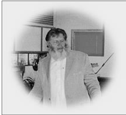
استس خپله کیسه داسې پیلوي:

ژباړه: «چاته چې الله د لارښوونې اراده وکړي د هغه سينه د اسلام لپاره پرانيزي او چاته چې په گمراهۍ کېنې د غورځولو اراده وکړي د هغه سينه تنگوي او داسې فشار پرې راولي چې (څنگه د اسلام تصور په ذهن کې راگرځوي نو) داسې ورته معلومېږي ته به وايي ساه يې د اسمان ولورته ته رابنکله کيږي».