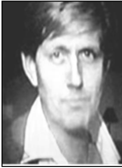
مخکی له اسلامه