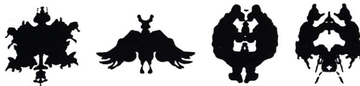
شکل ۲-۲. لکه‌های جوهر رورشاخ

دیگری است که حاوی مجموعه‌ای از تصاویر مبهم است. در این آزمون از درمان‌جو خواسته می‌شود تا در مورد آنچه در هر تصویر اتفاق می‌افتد، داستانی بسازد.