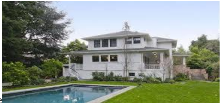
Mark Zuckerberg home

کوي او مارک په ۲۰۱۱ کې د کریسنت پارک تر څنګ د خپل ګاونډې کور په ۷ میلیونه ډالرو کې پیروود کړ.