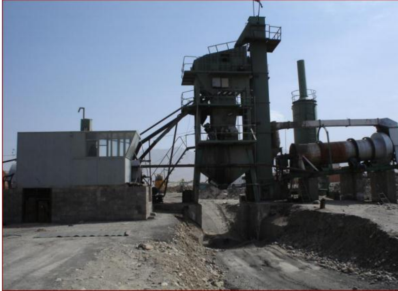
فابریکه تولید اسفالت