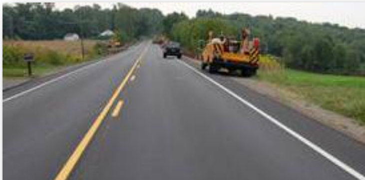
Figure shows the flexible pavement

غیر از سرک ها کانکریتی دیگر تمام سرک ها بنام سرکها ارتجاعی یا نرم یادمی شود . سرک ها ارتجاعی بنام سرک ها اسفالت کانکریت نیز یاد می شود که اجزای ترکیبی ان ریگ ، جغل ، پودر منرالی و قیر مایع می باشد . باید تذکر داد که پودر منرالی به منظور چسپیش مخلوط مذکور استفاده می شود که پودر مذکور از سنک دولومایت تهیه می گردد. اعمار سرک های اسفالت کانکریتی نظر به سرک های کانکریتی اقتصادی بوده اما عمر کمتر داشته و حفظ و مراقبت بیشتر میداشته باشد .