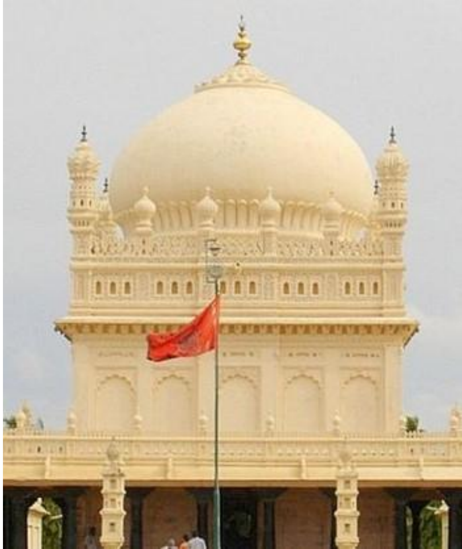
د تیپو مقبره