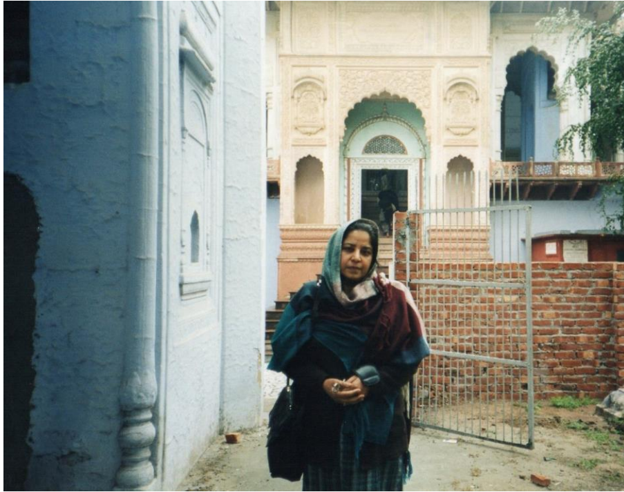
ليکواله په سر هند کې د شاه زمان مقبرې سره

کوو، هغه چې د هند خاوري ته يې خو واري تکل وکړو، اخر هم دلته خاوري شو.