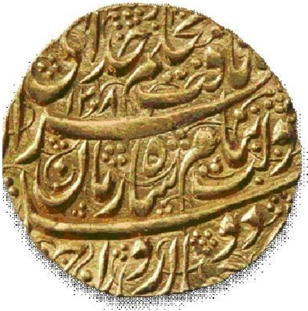
د شاه زمان سکه