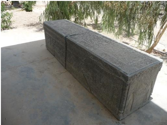
د اطلاعاتو او کلتور په ودانی کی تاریخي اثار