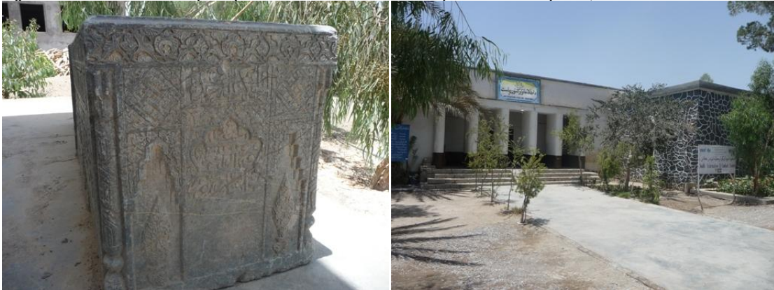
داطلاعاتواوکلټوررياست دځينو برخوانوږونه

پواسطه دښاغلي پتياڼي صاحب اوډده د همکارانوڅخه دزره له کومي مننه کوم هيله لرم چي دفرهنګي چاروپه پياوړتياکي يي بري نصيب شي.