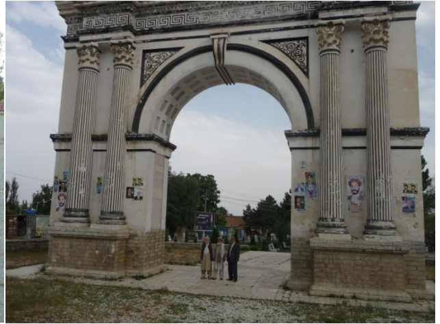
د پغمان پارک

وروسته د پغمان بڼکلي پارک ته ورغلو مگر دخواشینی ځای داو چې د پخوا په څیر ټولې شنې ونې ، گلونه اونورڅه په جگړو کې له منځه تللي وو. ولې نوی جوړ شوی پارک بڼکلی بڼکاریده او د گلونو باغچويي بڼکلارامنځته کړې وه. د پارک په مینځ کې مې دهمغه ځای دخوتنو اوسیدونکو سره خبرې وکړې چې په ډیره خواشینی یې د پغمان پر خلکو او دغه بڼکلو پارکونو باندې دشورای نظار او جمعیت اسلامي د جگړه مارو وحشتونه راته بیان کړل. داسې یې راته وویل! « بردار مې فهمی تمام چار اطراف را که تومشاهده میکنی، درخت بود، گل بود چمن سرسبز بود ولی توفکنداران شورای نظار همه ای سرسبزی هارا نابود کردند».