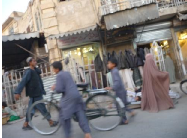
دميرويس نيکه مقبره

په زيارت کې مې يوزره پورې سړی وليد. داسړی فارسيزبی اودهرات ولايت اوسيدونکی و. نوموړي راته وويل چې په دې وروستيووختونوکې مې دميرويس نيکه دشخصيت په هکله ډيرڅه ولوستل، نومې پريکړه وکړه چې زه به دده زيارت ته حتمي ورځم. دادی اوس ځان بختورگنم چې دميرويس نيکه دمقبري زيارت کوم. دميرويس نيکه دمقبري زيارت ته هڅوي چې دخپلو نامدارو مشرانو قبرونوته راشواوځان ته ددوی دغيرتمنوکارناموپه يادولو جرأت اوزړه وړتياورکړوچې داهيوادواحد او يو موټی وساتو. زمادسفرموخه يوازي اويوازي همدادميرويس نيکه دزيارت ليدنه وه اوسباپه خيربیرته ستنيړم. نوموړي زماسره دزيارت دبيلابيلوبرخود انځورونوپه اخیستلوکې ډيره مرسته وکړه.