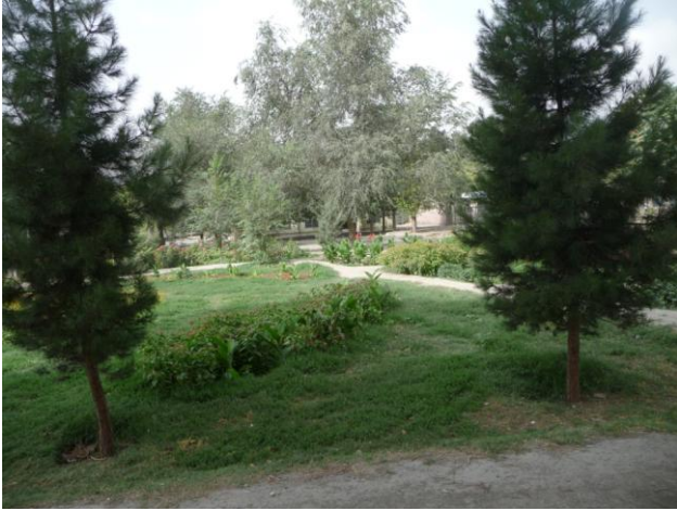
دنوي ښار دپارک انځور