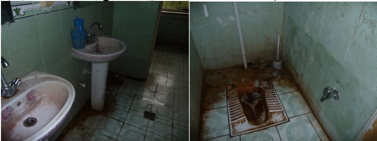
په يوه وزارتخانه کې دتشنابونو انخوړونه

مخامخ دي. ددې چارې دحل کيلي دولس سره نه ده. دتشنابونو جوړول د کابل بناړوالی اوپه ټوله کې د چارواکو دنده ده. ولي کيدای شي چې لوی هټيوال په دې اړوند مرسته وکړي. دمیلونونوپه ارزښت يوه ښکلې ودانۍ جوړوي نو کيدای شي څنگ ته يې دعامه گټې اخيستني لپاره څو عصري تشنابونه هم جوړ کړي. دابه ومنوچې په ساتنه کې ددولت او خلکو توجه لازمي ده. داچې په بناړکې ټول شنه چمنونه دزور واکانو لخوا غصب شوي دي ، دکابل چاپيريال يې نور هم ککړ او داندېښني ورگړزولای دی. غواړم دموضوع په شاليد لروړ غېرم :