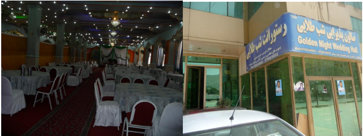
دشبی طلايي هوټل انځورونه