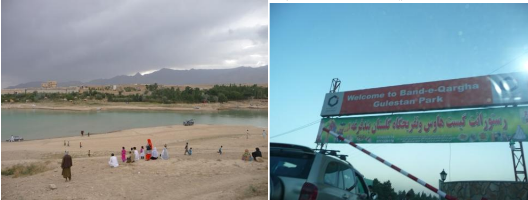
دقرغی دعمومي دروازي اوبندانخوړونه