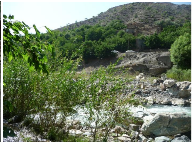
دسالنگ دميلي انخورونه

غواړم دي ځانگړي موضوع ته دخپل سفرپه جريان کي اشاره وکړم: سالنگ اوهم دمزارشريف په سفرکي مي يوي موضوع ډيره پاملرنه جلب کړه: « دلاري په اوږدواوهم دمزارشريف بنار اودفتر ونو کي داحمدشامسعودانخورونه دافغانستان داوسني ولسمشر حامدکرزي دانخورونوسره څنگ په څنگ خورندوو.