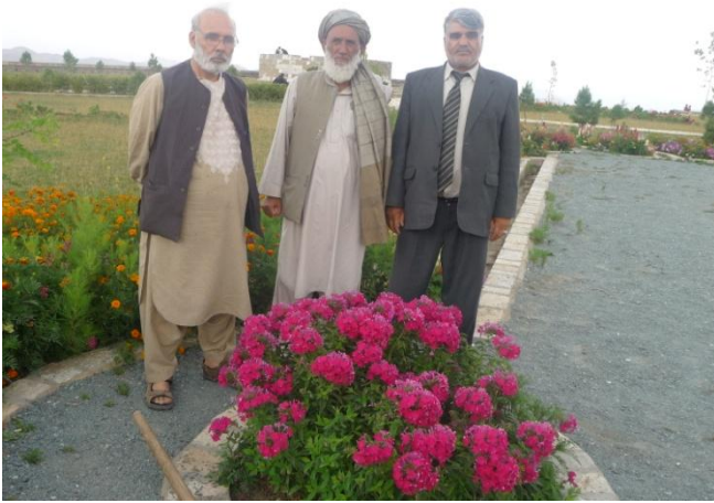
د طاق ظفر انځور