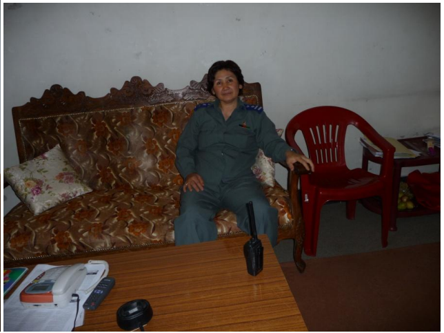
د کابل بنځینه زندان د قوماندان انځور