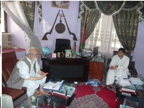
د پتیال انځور

د طلوع اخبار (۸۹) یمه کلیزه وه. داخبار پر کیفیت او تاریخي قدامت موخبري وکړي. دا هم جوته شوه چې دخلکو دخبرتیالپاره یوازنی معلوماتي سرچینه همدغه اخبار دی ولي دمالي لحاظه یی لازم ملاتړنه کیری. کیدلای شي دیوه لوکس زري موټر په بیه داخبار بڼه بیخي بدلون ومومي. خبره داده چې ډالر بادیري ولي دومره مهمي فرهنگي چارې ته لږه پاملرنه کیری. د غونډې په پای کی نوموړي دکندهار د لیکوالوڅوټوکه کتابونه دسوغات په ډول راکړل. اودودانی دمختلفو برخو عکسونه یی د اداري یوکار کونکي، زما د کامروپه واسطه واخیستل. چې زه ددغې لیکنې