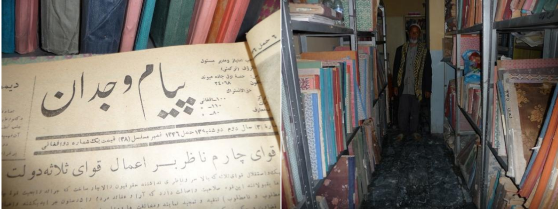
د پيام وجدان ورځپاڼې يوه بيلگه

چې دورې دومره غوړې وې چې په لاسوپورې مېنتې وې اوبيليدل يې اسانه چاره نه وه. حيدري صاحب هم په ډيرتودخای کې ناست و، چې دکوتې ديخولو او يانور اړين وسايل يې په واک کې نه درلودل. که به يې اوبوته اړتيا پيدا شوه، خوځلي به يې بابا ته په لوړ او ازبغ کاوه چې دده بيچاره حالت زه ډير زور ولم. داسې معلومات هم راکړل شول چې نوموړی يو ډير بښه ليکوال دی. په دننه کې مې ډير عکسونه واخيستل ولې بله ستونزه دا وه چې د بهرڅخه يې د عکس اخيستلو اجازه نه راکوله چې د عامه کتابتون د بهرڅخه عکاسي وکړم. په دليل يې ونه پوهيدم ولې داپريکړه دپهره دارپوليس په واک کې وه. داستونزه مې يو دوست افسر راته حل کړه. داسې معلومات مې هم تر لاسه کړل چې د عامه کتابتون يوه برخه زور واکانو ديوي ودانۍ د جوړولو لپاره نيولې ده.