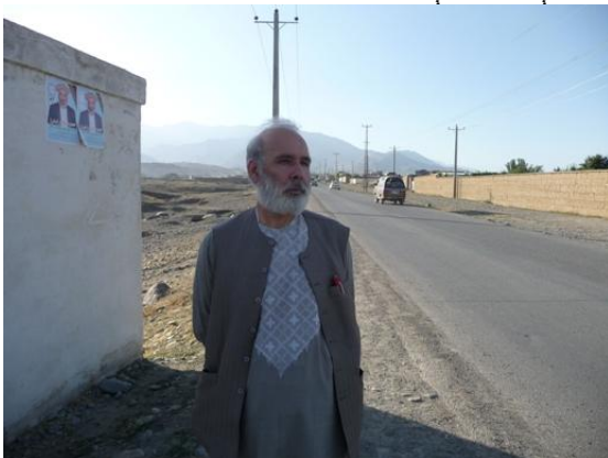
دکندهار دښاريوه برخه

دکندهار په اوسنيو حالاتو کي دښځو نهضت دډيرو گواښونو سره مخامخ دي. په دې اداره کي کارکول داسي دي لکه څوک چي ديوې جگړه ايزي جبهې په لومړي ليکه کي په جگړه اخته وي. تاسوبه اوريدلي وي چي برسیره پر نورو ښځينه فعالينو خپله دښځو د چارو مشره څوکاله مخکي ووژل شوه ، روح دي يي ښادوي. دارياست پريوپراخه اولوي سپرک پروت دي، چي مخي ته يي يوځوان سرتيري ولاړو.