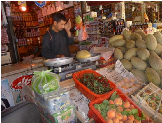
په جبل السرج کې دامیر حبیب الله مانی