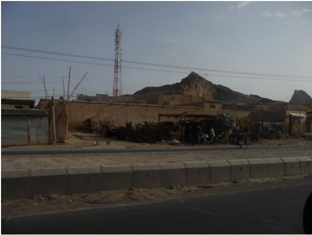
دکابل نوی بشار

راچاپيردي ، بلاگاني دي ، توري تيارې دي. کاشکي هغه ستاگيله من خزان هم زموږ دزخمي بچوپه نصيب کي وای . مگر نه ، ای پرهيوادمين شاعره!.