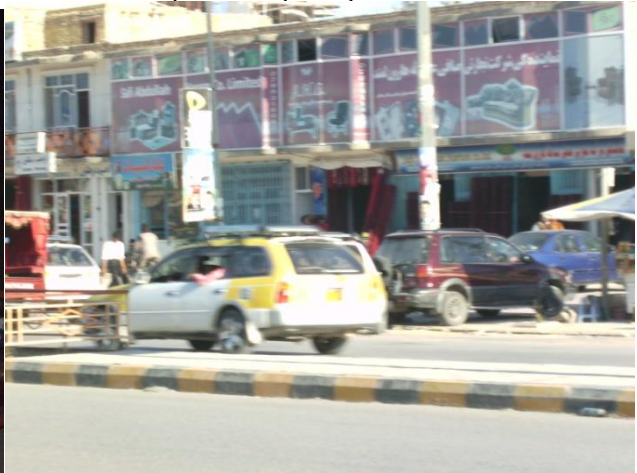
دمزار شريف دښارانځور