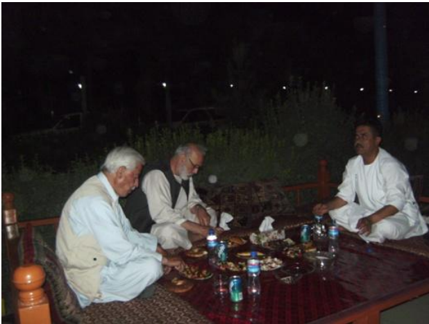
په الماس رستورانټ كې

دشپي ډوډي مودمزار په يوه بڼكلي رستوران كې چې (الماس) نومېده، وخوره. هيره دې نه وي چې مخكې تربيرته گرځيدني مودسباورځي پروگرام جوړ كړ.