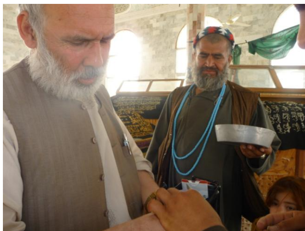
دباباصاحب دزیارت دملنګ

ولې دباباصاحب زیارت ته دلارې په اوږدوکې یوه شي زماډیره توجه جلب کړه. هغه دهمدې لارې په یوه سیمه کې دگل اغاشیرزوی په نوبت دیوه لوی پارک جوړه شوي نقشه ده اوکاريې هم ورباندي پیل کړي دی چې په راتلونکې کې به دخلکو د میلویومناسب حای وي. ولې زموږپه هیوادکې برسیره پرنوروستونزووتوکمیزی