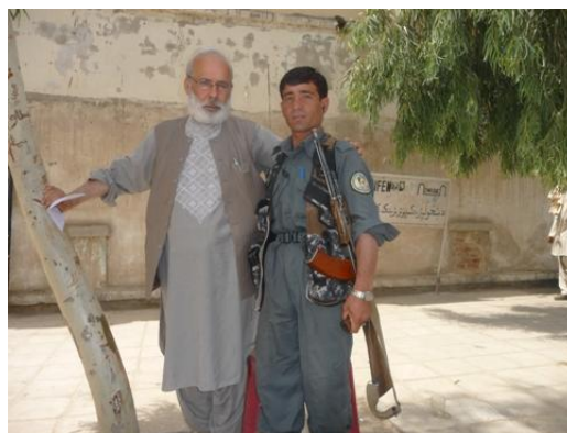
دکندهار دښځو دچارو رياست ساتونکي

زماددوست له خواراته په ډاگه شوه چي دلته راتلل دخطرڅخه خالي نه دي. خوما وپتيله چي ډارځکه پکارنه دي چي زماميرني خویندي په همدې ځای کي په دنده