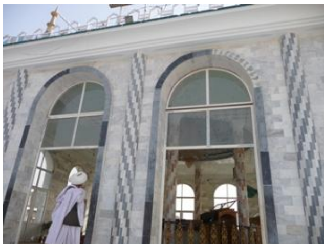
دبابا صاحب زیارت

دباباصاحب دزیارت لیدنه هم په زړه پورې وه. دلارې په اوږدوکې شني سیمې او باغونه ترسترگوکیدل ، ولې ترڅنګ یې دبهرنیو پوځیانولویې ادې هم پرته وې چې دبرجونو اولویوکانکریتودیوالونوڅخه دجګړې بوي راخوت. دباباصاحب زیارت په رښتیا دکندهار دپخواني والي گل اغاشیرزوی دهڅوپه نتیجه کې دخلکودمیلو اوخوښیو په حای باندي اوبنتی دی. دزیارت بیلې بیلې برخې مې وکتلې . دزیارت دیو ماهر ملنګ معلومات مې په ملنګانه ژبه واوریدل ، دامعلومات مفت نه وه دسلو افغانیوپه ورکولوبیا هم ملنګ خوښ نه معلومیده. دزیارت سره نژدې یوښکلې هوټل اومنظمي باغچې دشنوچمنونو اوگلانوپه درلودلوسره دسیمې ښکلانوره هم زیاته کړې ده.