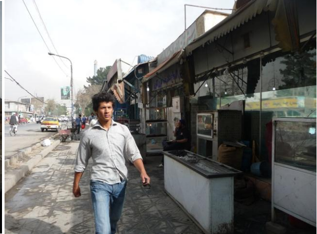
دپغمان ددوی لاری سیمه

نوردي دهيوادپالني اميدونه په رنخونونه بدلوم که ژوندی يي نوراته ووايه چې اوس به دخپل هيوادلپاره په خپلوخوږواوهيوادپالني تودوولولو، تودوبیتونوکي څه راته ووايي؟ اوددي هيوادلپاره دي هيله څه ده؟ راته ووايه چې ددي تپونودعلاج لپاره کوم طبيب پيژني اوکه يوازي په دو عاگانو اوزاريو تربمونولاندي کبنيو؟ ځوانان مودخان وژونکو واسکتونو اودتل لپاره دپرديودهيلو قرباني شي که څنگه؟ زه چې سوچ کوم زموږ هډونه لاڅه بلکي دچو هډونه به موهم په دي هيله خاورې شي ، هغه خزان چې تاگيله ورنه درلوده ، يووارياراشي.