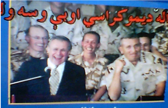
د امریکا د جنگ وزیر د افغانستان له نیولو وروسته

افغانستان د امریکا بل ویتنام ————— یرغل په تصویرونو کی