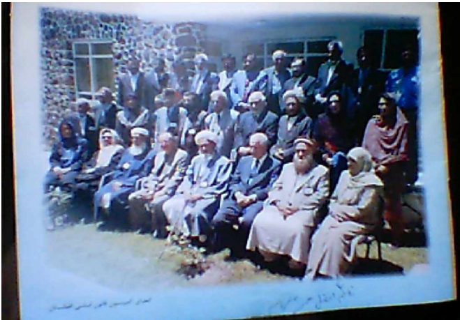
د امریکائیائی نیواکگرو له لوری د اساسی قانون د لوبی لپاره استخدام شوی خیری