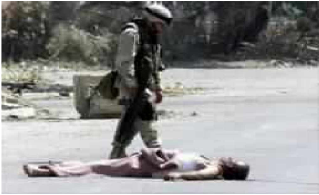
امریکائیان او په سرکونو پراته مړی

افغانستان د امریکا بل ویتنام _____ یرغل په تصویرونو کی