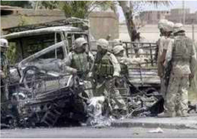
هره ورځ په افغانستان او عراق کی د امریکائیانو گنشمیر گادۍ تخریب کیږی