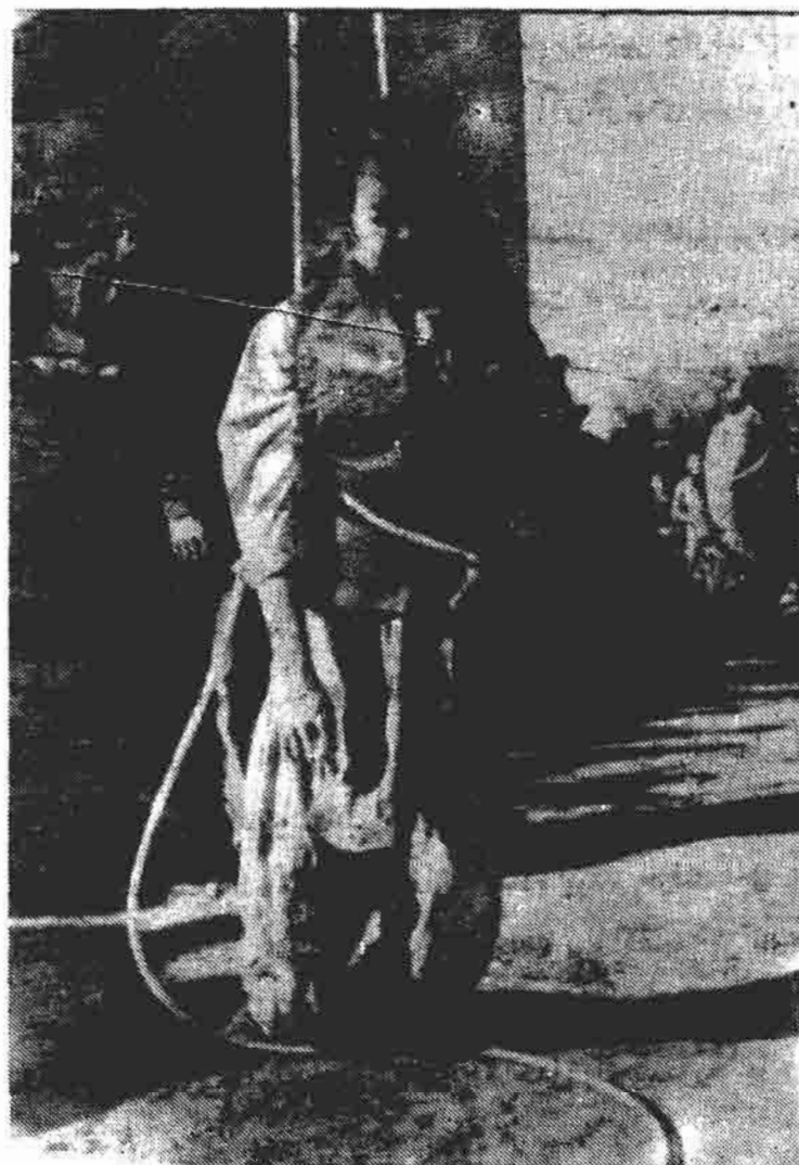
سرگهان ۲۷ سپتامبر ۱۹۹۶ خلیان، اجساد داکتر نجیب و برادرش را که بقول ویکیند پوست تاریخ ۴ اکتوبر ۱۹۹۶ «قصای بی خبر» کرده بودند در چهار راهی آریانا کابل آویزان نمودند.

عکس العمل های مردم متفاوت بود عده که او را مانع صلح میدانستند خوشحال بودند که این مانع از راه برداشته شده است؛ حزب و روشنفکران وطن هیچگاه او را نمی بخشیدند، زیرا که آنها را بدون سرنوشت رها کرده بود، عده بی بسی تفاوت بودند ولی هیچکس برای او حتی اشک تمساح هم نریخت.