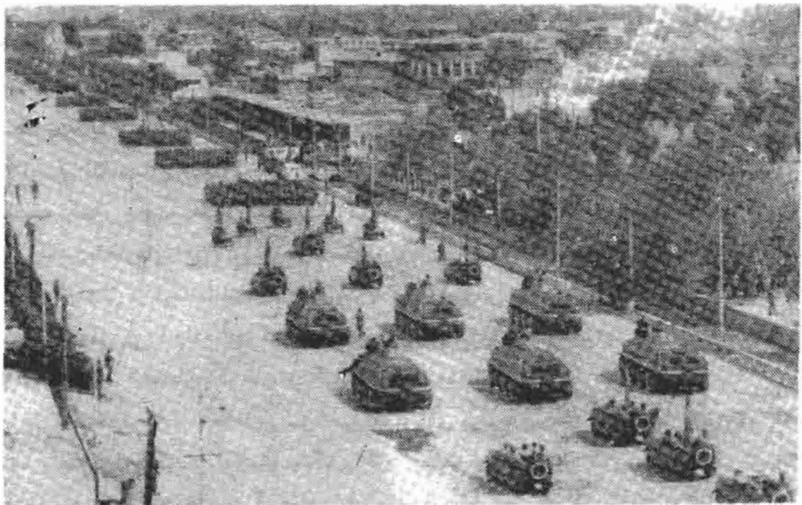
صحنه‌ی از مراسم رسم و گلشت قطعات قرای مسلح افغانستان

رنج و عذاب مردم بود و مردم هم ما را و هم مجاهدین را به یکسان دشنام میدادند و از خداوند برای سرنگونی مان کمک می خواستند. تلفات مجاهدین الی ۲۵ جدی ۱۳۶۵ از روی احصائیه گیری و اسناد ستر درستیز اتحاد شوروی یکتیم میلیون نفر شهید و یک میلیون نفر معلول و معیوب گزارش داده می شود. تلفات اردوی شوروی تا آن تاریخ دوازده هزار نفر و تلفات قوت‌های دولتی و حزبی الی ۳۸ هزار نفر که جمعاً ۵۰ هزار نفر می شد حساب می گردید یعنی در مقابل هر نفر از قوت‌های شوروی و افغانی ۳۰ نفر مجاهد شهید و ۲۰ نفر معلول گردیده بود اما این ارقام واضحاً مبالغه آمیز بود زیرا که من قبلاً علل آنرا بررسی کردم و آن عبارت بود از راپورهای خلاف واقعیت‌های قوماندانان اردوی ۴۰ و مشاورین آنها در اردوی افغانستان واقعیت این بود که تعداد کثیری از طرفین در نتیجه جنگها کشته می شدند زخمی و معلول می گردیدند و هر دو جانب قابلیت محاربه‌ی معینی داشتند.