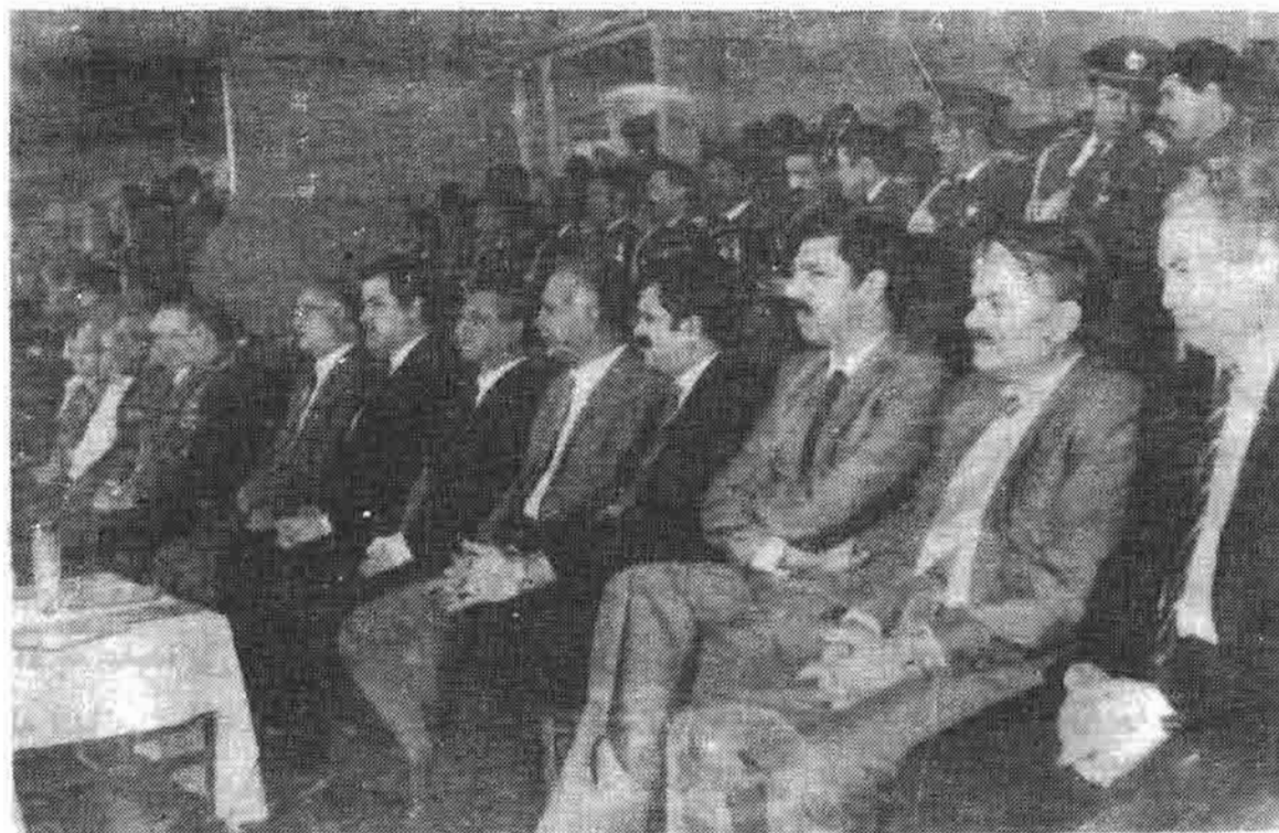
جشن اردو : دوکتور نجیب الله به صفت منشی عمومی حزب. د.خ.ا. هنگامیکه ببرک کارمل رئیس شورای انقلابی بود.

بحیث رئیس شورای وزیران ایفای وظیفه می کردند. تأکید بیشتر بالای رهبری دسته جمعی بعمل آورده شد. اما چنین امری نا ممکن بود. زیرا که در يك کشور دو پادشاه وجود داشت، و همانطوریکه گفته اند "دوپادشاه در اقلیمی نه گنجد" در کارهای روزمره دولت یکتو سکتگی، عدم همکاری و کارشکنی ها رونما گردید.