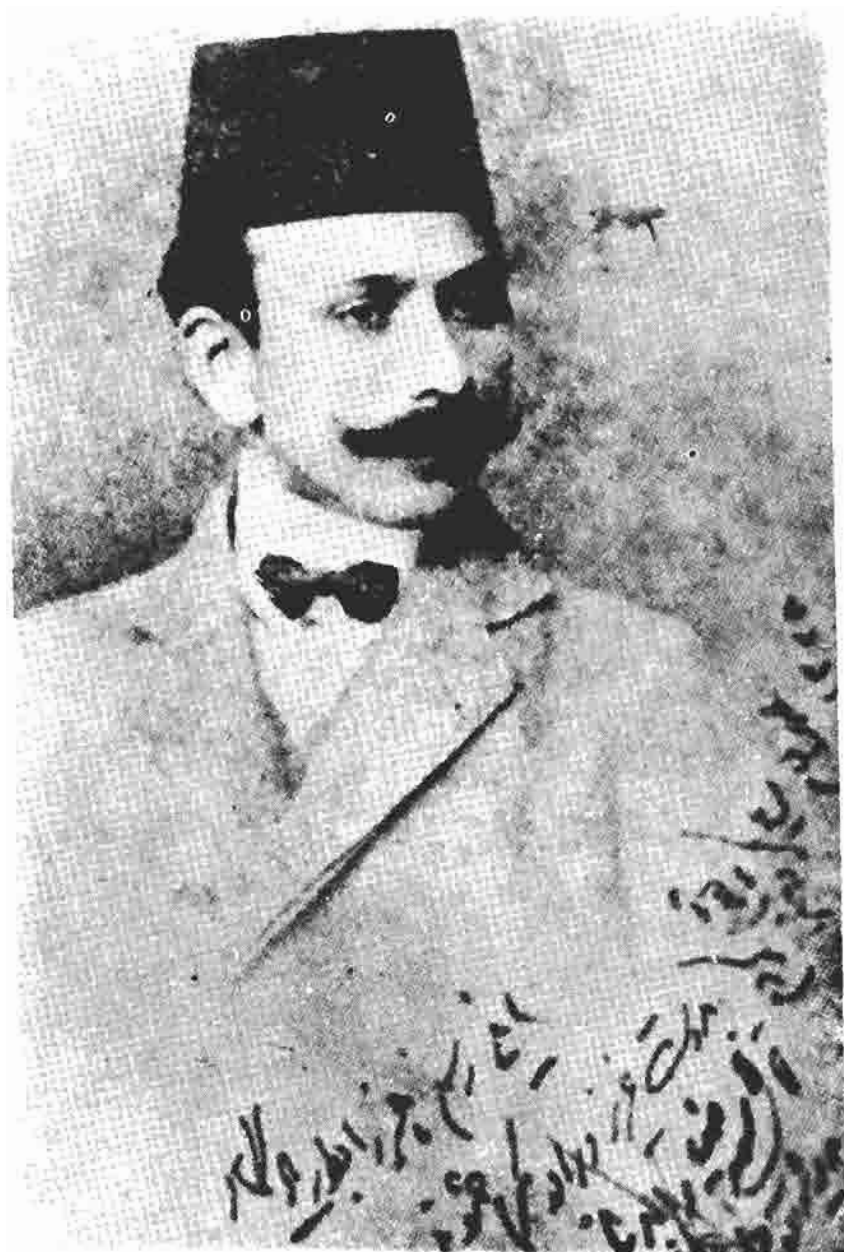
میرزا علی اکبرخان دهخدا