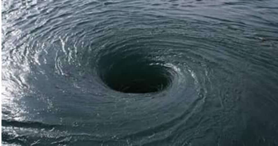
(۵) استار ټا يگر : (B.S.A.A Star Tiger)

يوه لويه باري کبنتی چي ۳۰۹ تنو سره يوځای په ۱۹۱۸ کال کي د برازيل څخه د بالتيمور په لور روانه وه ، خو هيڅکله هم خپل مقصود ته ونه رسیده. د برمودا مثلث په ساحه کي د دي کبنتی چا توتيه هم پيدا نکره اونه يي د تري تم کيدو په علت څوک پوه شول.