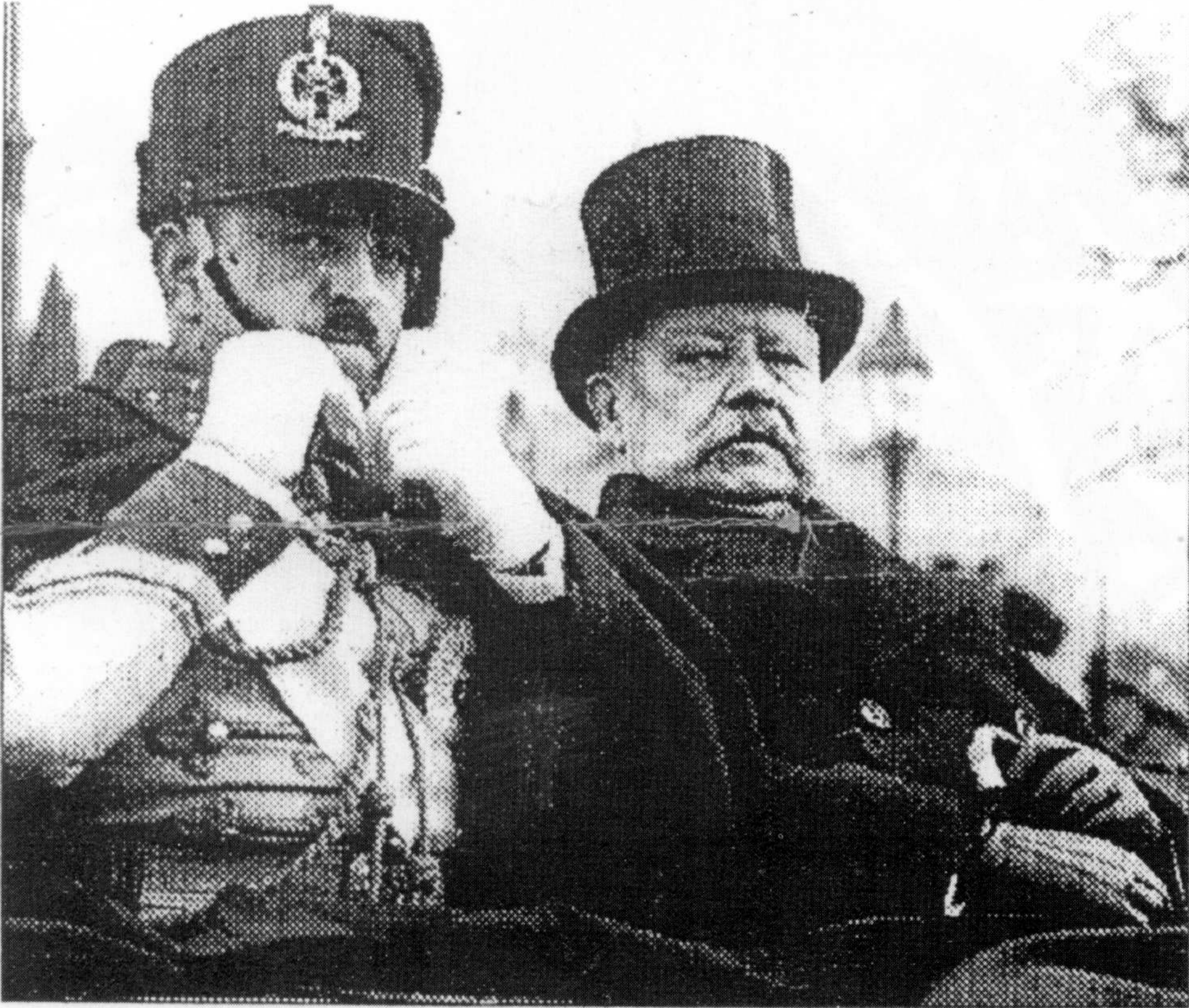
Glanzvoller Staatsbesuch: König Amanullah (links) 1928 in Berlin bei Reichspräsident Hindenburg.

Nicht erst seit dem Einsatz der Bundeswehr am Hindukusch fühlen sich die Afghanen — den Deutschen besonders verbunden