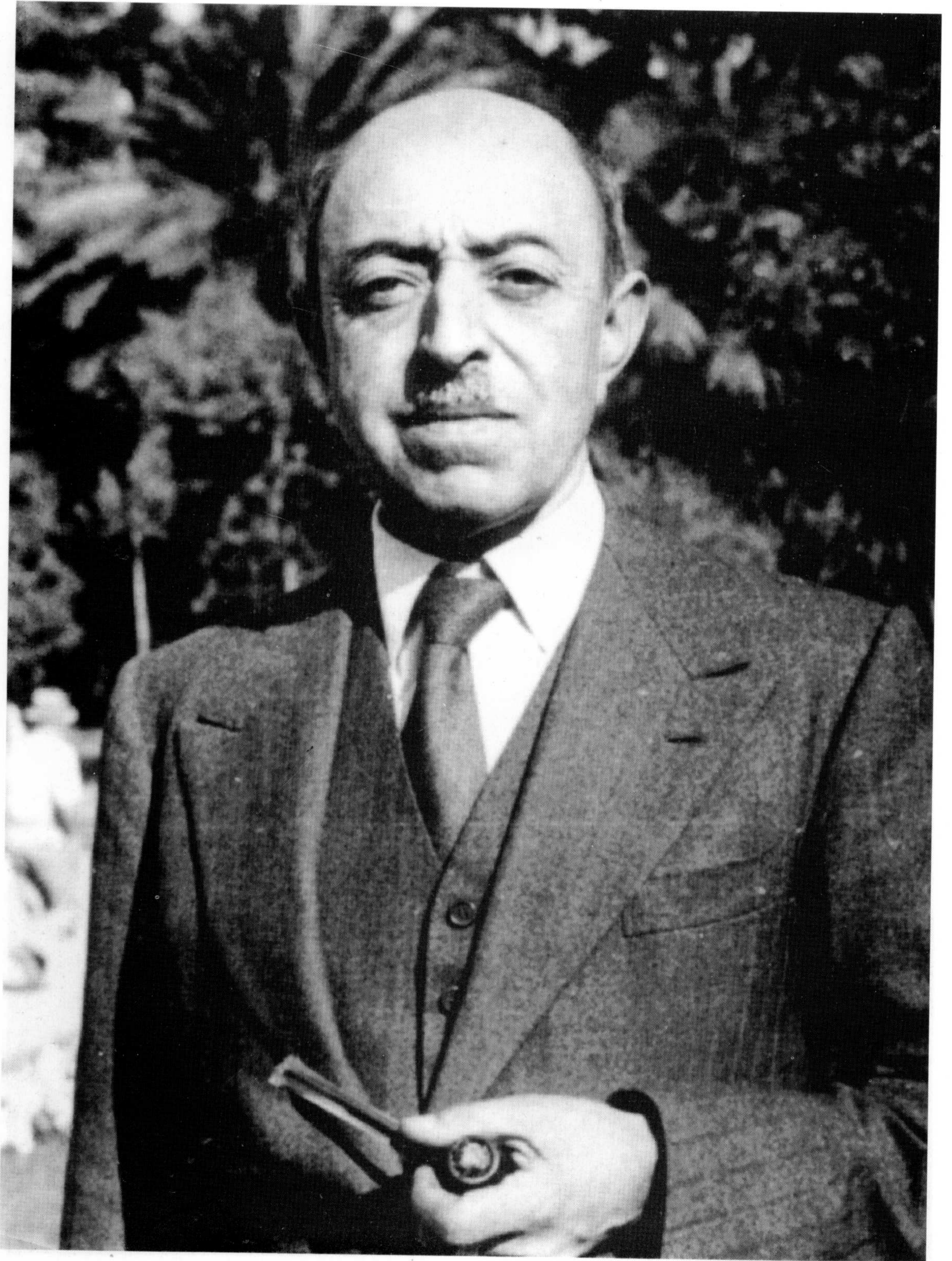
پاچان امان اللہ خان پہ روم (ایتھالیا) کھی