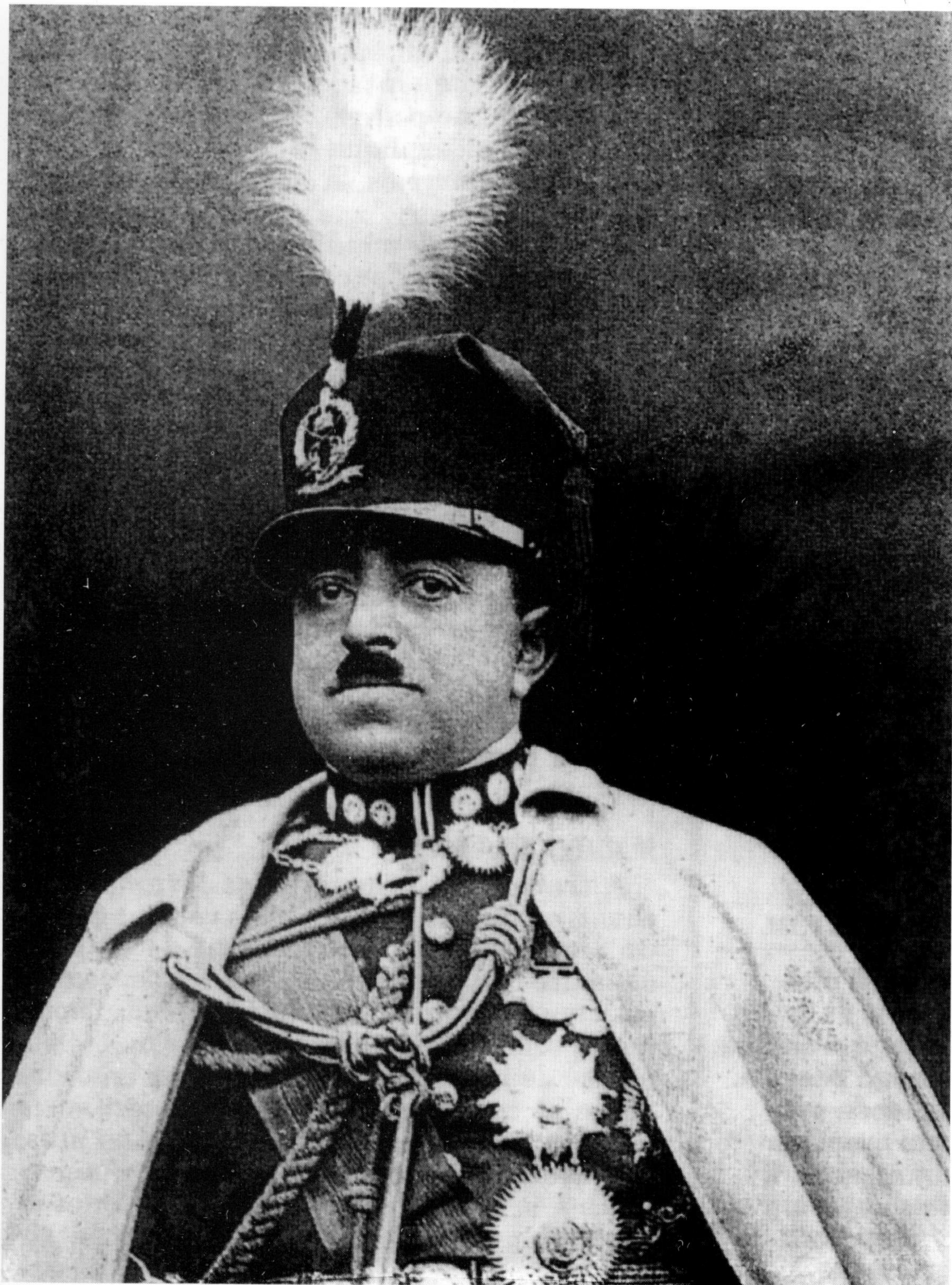
امير امان الله خان په فرانسه کې