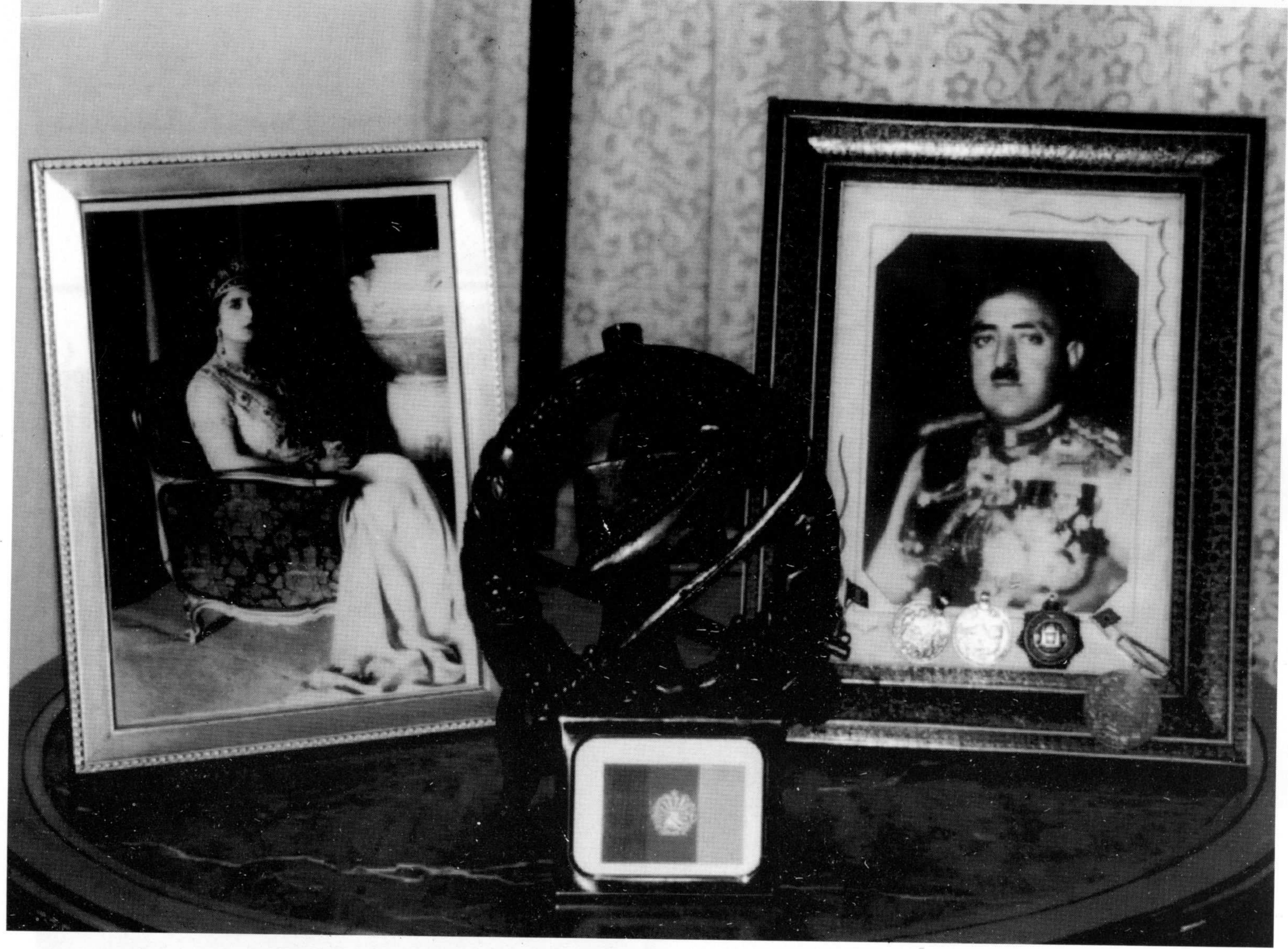
د امیر امان اله خان او ملکه ثریا عکسونه د هغې د زوی د میز پر سر