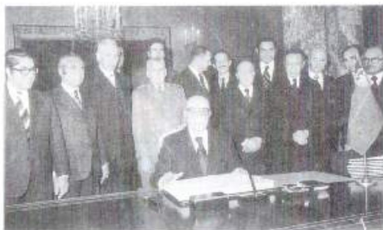
ولسمشر محمد داود نكابيني له غړيو سره