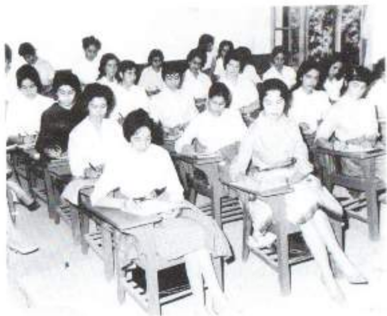
د کابل پوهنتون د ادبیاتو د پوهنځي محصلانې په کال ۱۹۶۰ کې