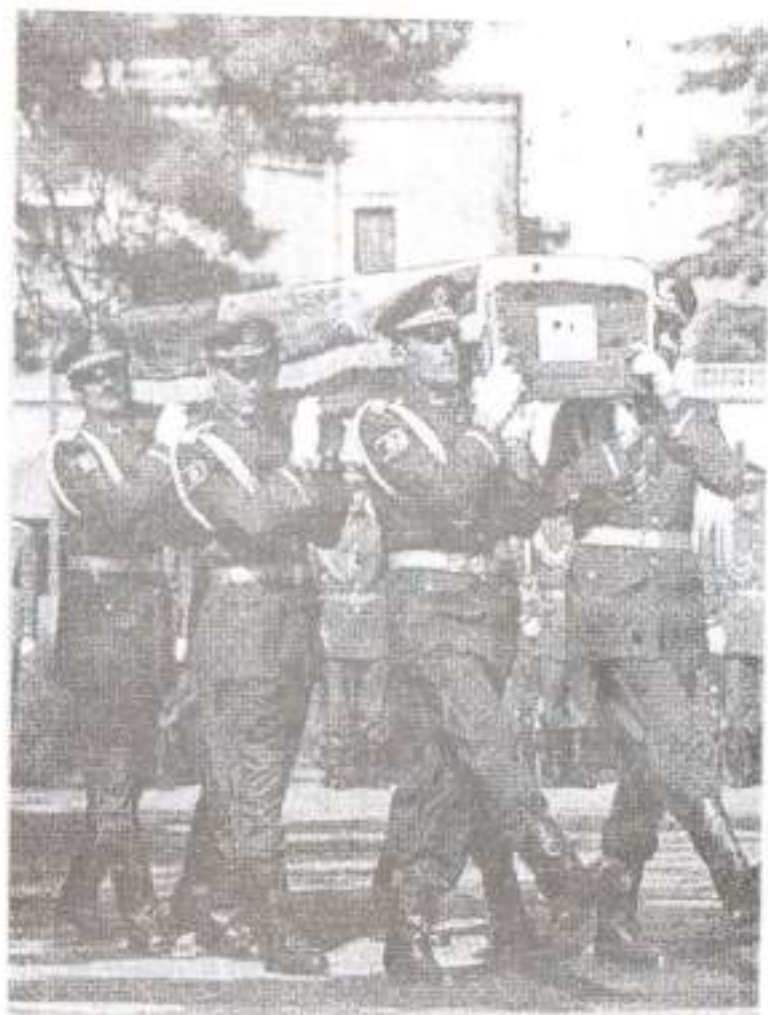
کابل، مارچ ۲۰۰۹ د افغانستان افسرانو له خوا د ارواښاد محمد داود چنازه هديرې ته د سپارلو په لور