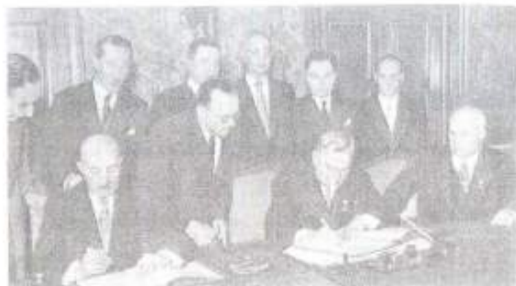
صدر اعظم محمد داود د شوروي اتحاد له مارشال بولگانين سره په ۱۹۵۵ کې د دو ستی د ترون د لاسليک په حال کې، له خروشچف او محمد نجيب او نورو لوړو چارواکيو سره