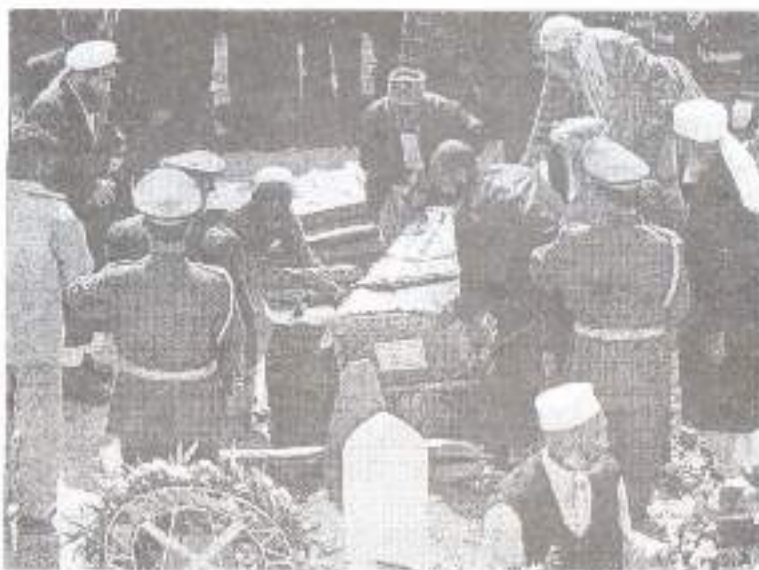
کابل، مارچ ۲۰۰۹ء: د ارواښاد محمد داود جنازه په دارالامان کې د محمد داود غونډۍ کې د څښولو په حال کې